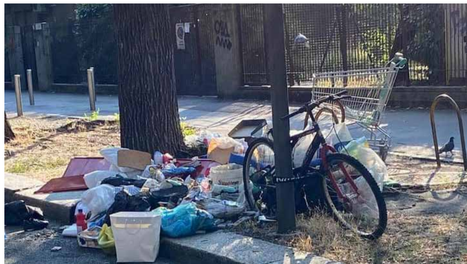
MILANO: via Raffaello Sanzio. L'inciviltà non va in vacanza