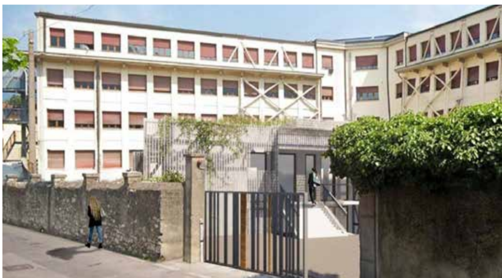
Il rendering dell'ospedale di Iseo