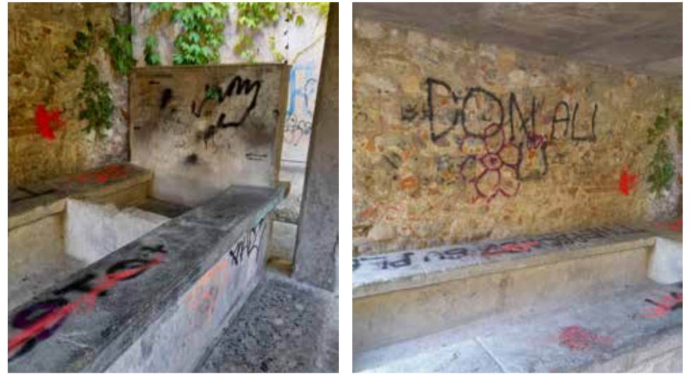
ISEO: atti di vandalismo al lavatoio