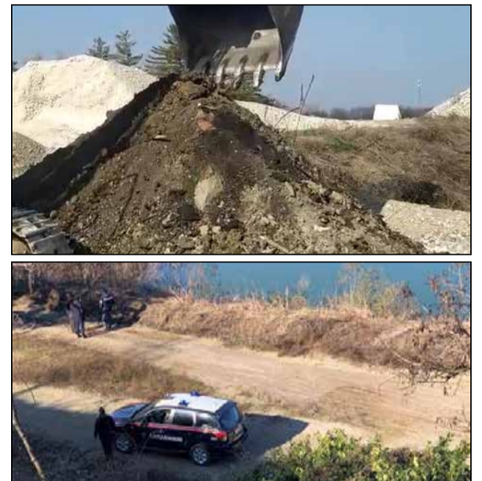
Il materiale scoperto e i Carabinieri durante i controlli

Inviare Cv alla mail: claudia.scalvini@alumec.com