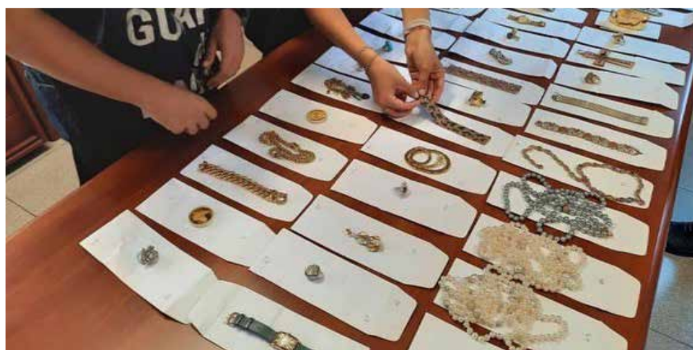
I beni sequestrati dalla GdF di Brescia

La Guardia di Finanza di Brescia ha evidenziato che il sequestro in parola è stato disposto sulla scorta degli elementi probatori acquisiti in fase di indagine preliminare, pertanto, in attesa di giudizio definitivo, sussiste la presunzione di innocenza. ■