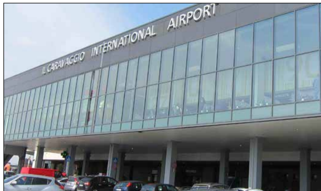
L'aeroporto di Orio al Serio

L'accordo sottoscritto con Brebemi ci proietta in una dimensione operativa totalmente green, che potrà essere raggiunta anche attraverso la migrazione della tecnologia applicata alla A35».