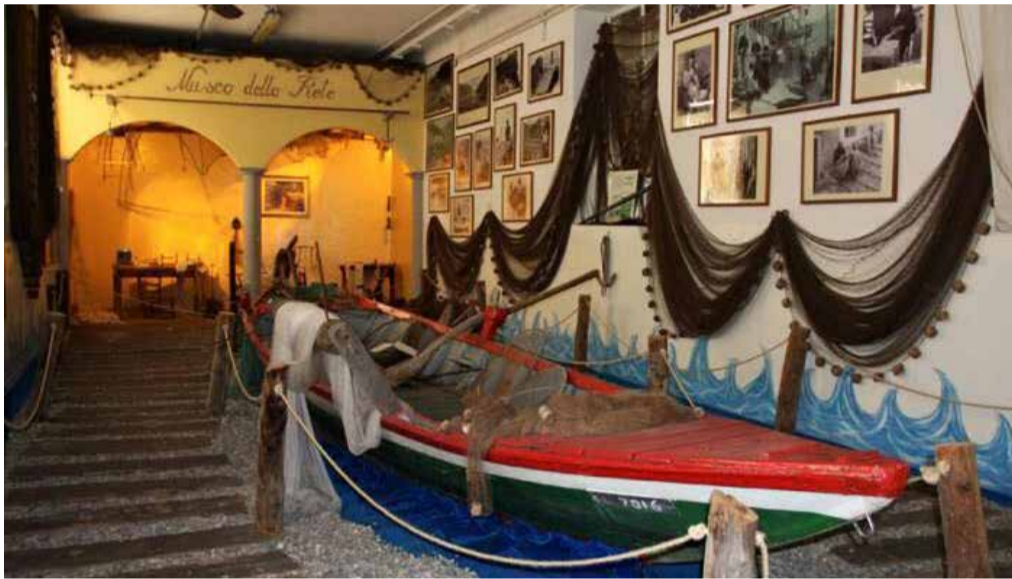
Il museo della rete a Monte Isola

culturale espositivo di Monte Isola che dovrebbero essere completati entro il 2023, permettendo così al nuovo spazio di entrare nel circuito creato per Bergamo e Brescia capitali della cultura. ■