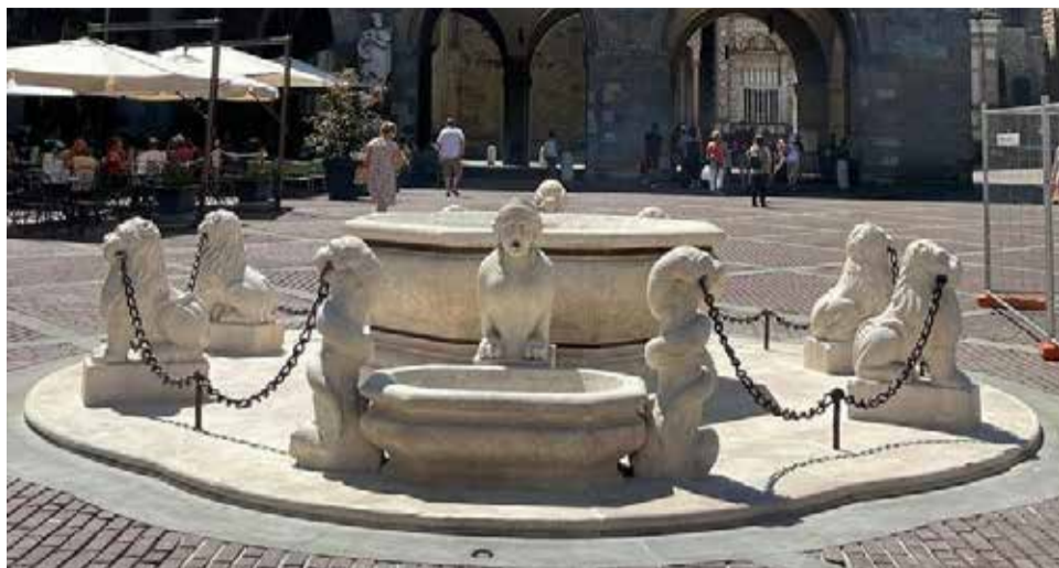
BERGAMO: la fontana del Contarini è stata sottoposta nei giorni scorsi a lavori di manutenzione che hanno permesso di ripristinarne il funzionamento