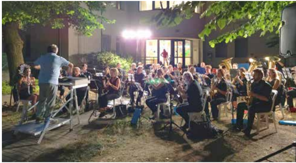
La Banda Cittadina d'Iseo in concerto a Pizzone