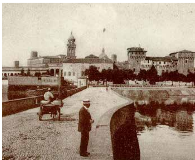
MANTOVA: una cartolina storica del Ponte di S. Giorgio.