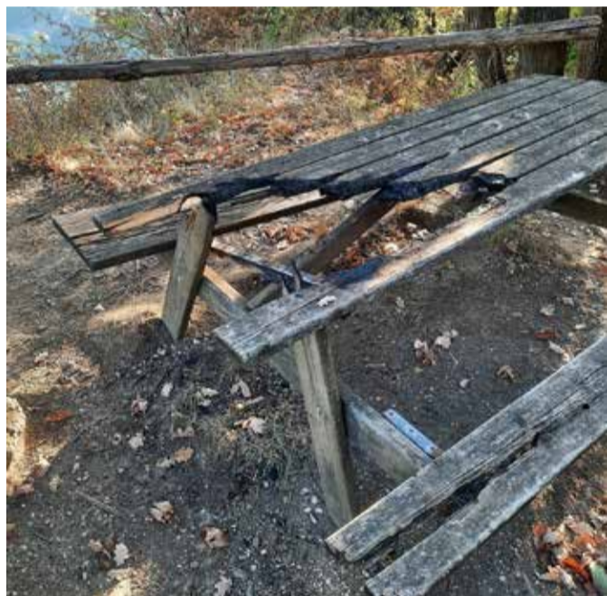
L'atto vandalico alla panchina sul sentiero della Forcella Molere