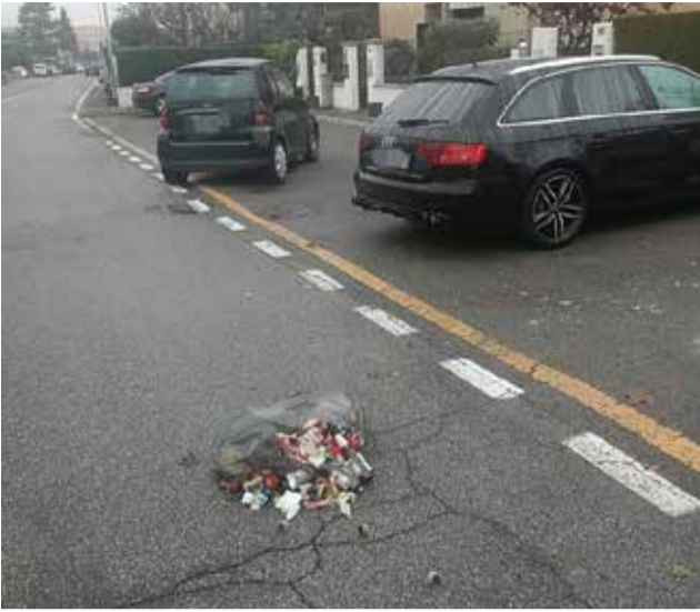
Vetro, carta e plastica tra i rifiuti abbandonati per strada