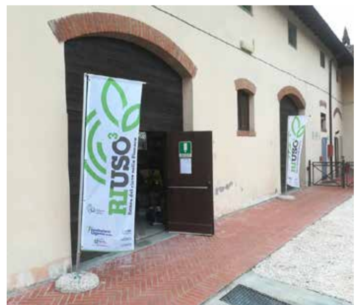
Il Banco del Riuso di Lograto