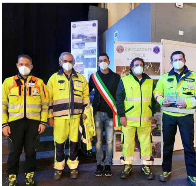
I rappresentanti della Protezione Civile Rovatense premiati a Brescia