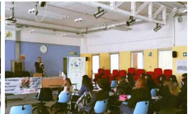
L'incontro al Gigli con la Qwarzo Spa