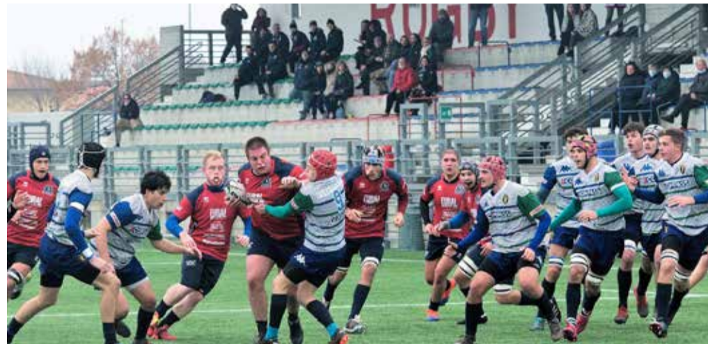
U19. Nordival Rovato 35 Cus Milano 5

"Sono molto soddisfatto per aver chiuso la prima parte della stagione al terzo posto nel