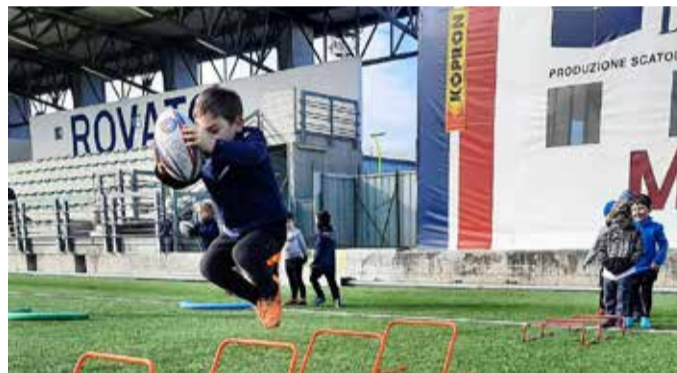
RUGBY ROVATO: l'allenamento Under 6