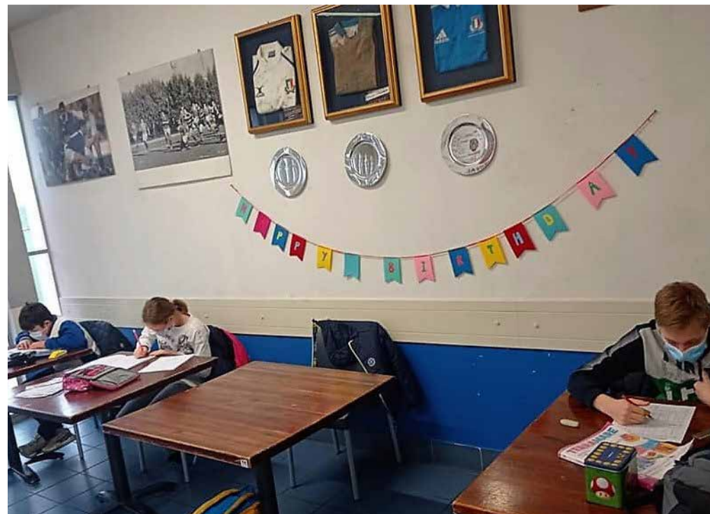
Smart School, è il momento dei compiti