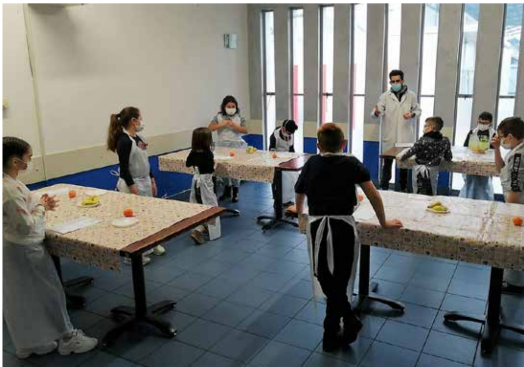
Smart School: il laboratorio alimentare