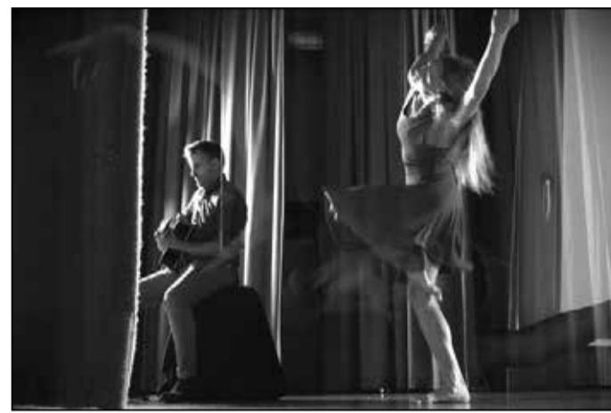
I due artisti durante il lavoro del videoclip