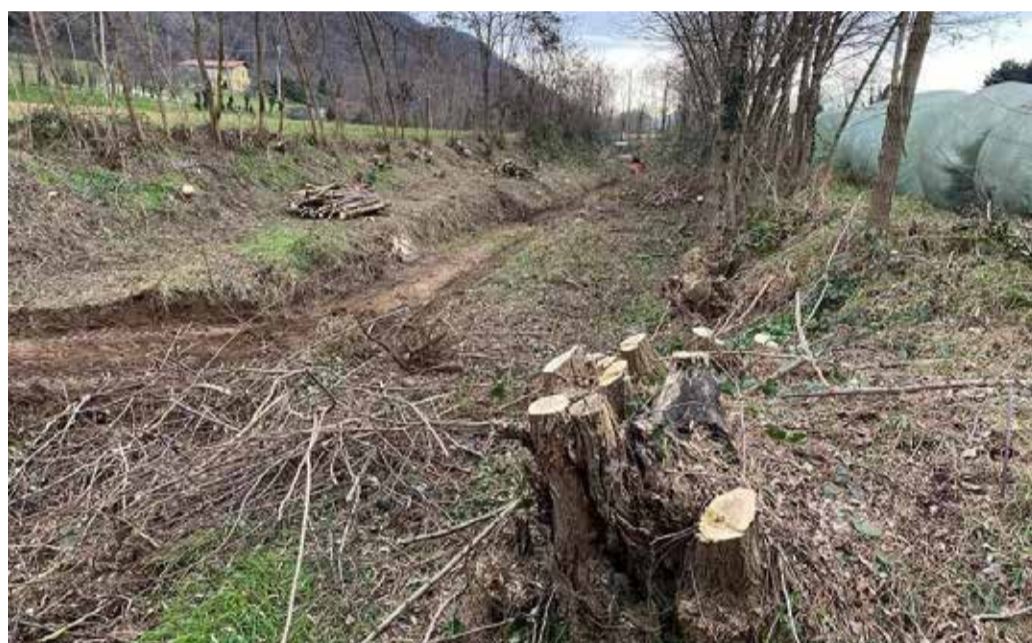
I lavori al torrente Carera

Il Giornale della LOMBARDIA Under Brescia Il Giornale di ISEO e del Sebino