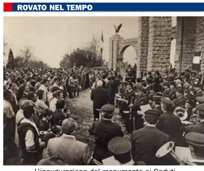
L'inaugurazione del monumento ai Caduti sul Monte Orfano nel 1974