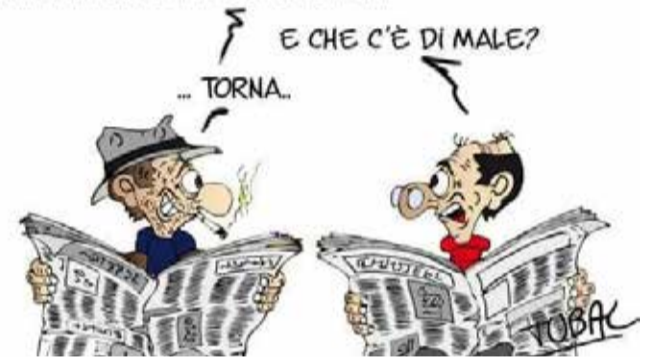
A volte tornano

È SCANDALOSO! RENZI VA IN ARABIA PER UNA CONFERENZA!