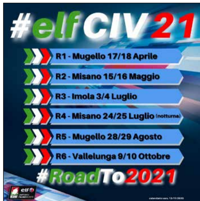
Il calendario delle gare

Elemento che aggiungerà emozione e adrenalina ad un campionato già di alto livello. ■