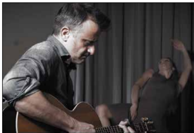
I due artisti

Viale Marconi, 3/B - Chiari (BS) www.servizimediscancarolo.it