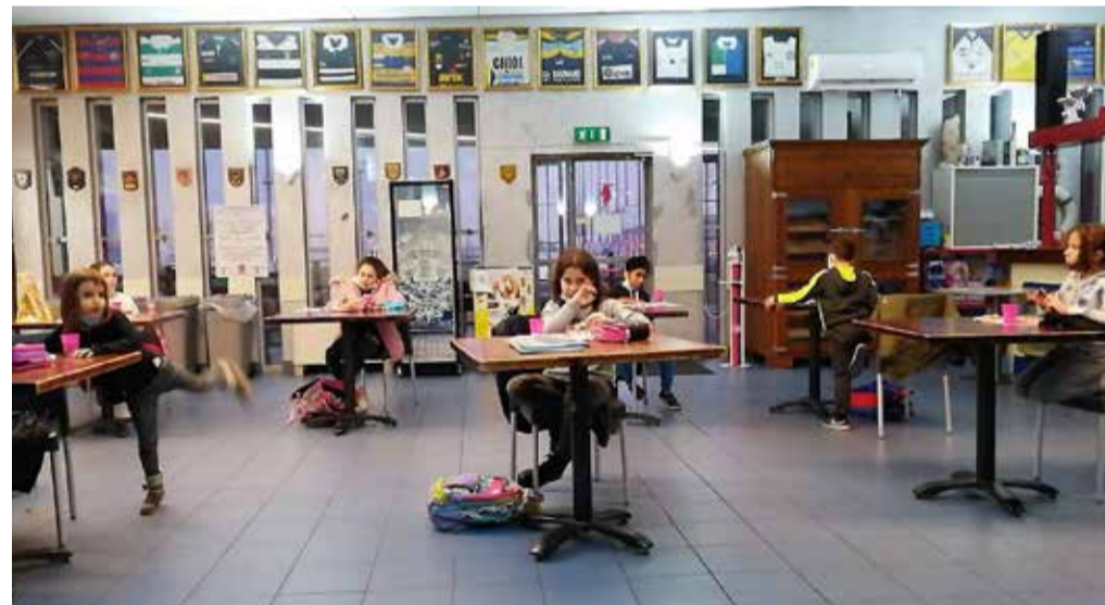
Il distanziamento dei banchi durante la Smart School