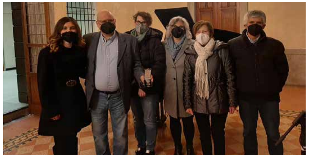
La famiglia Morandini con la Medaglia d'Onore