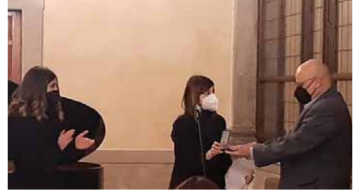
La consegna della Medaglia d'Onore

visto alcuni dei migliori allievi della Scuola d'Armonia H. Strickler esibirsi in brani di autori classici, moderni e di origine folclorica, intervallate da una serie di riflessioni su universalità, complessità, disciplina e consapevolezza. ■