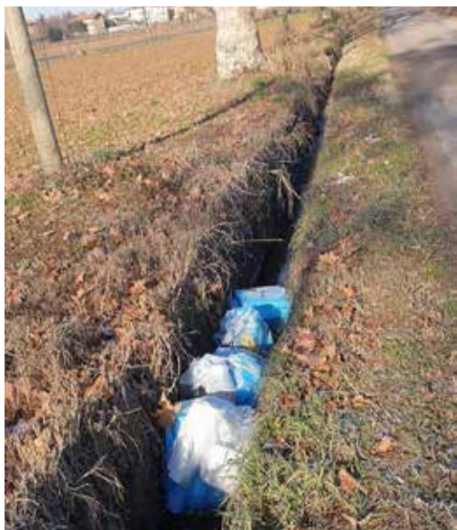
Numerosi sacchi di rifiuti abbandonati nei fossi