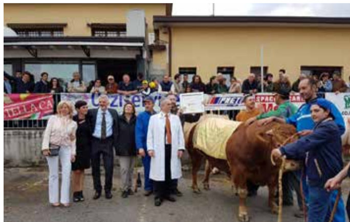
Una delle passate edizioni di Lombardia Carne

so verso la tanto agognata normalità. Nelle prossime settimane sui canali ufficiali del Comune e di Lombardia Carne verrà presentato il programma della manifestazione. ■