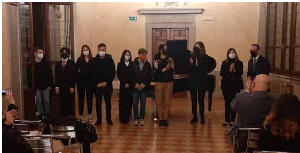
Gli allievi della Strickler che si sono esibiti durante la serata