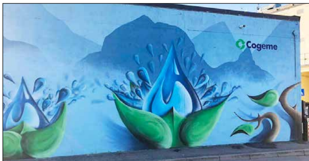
Il murales realizzato per il progetto “Cogeme Street Day”