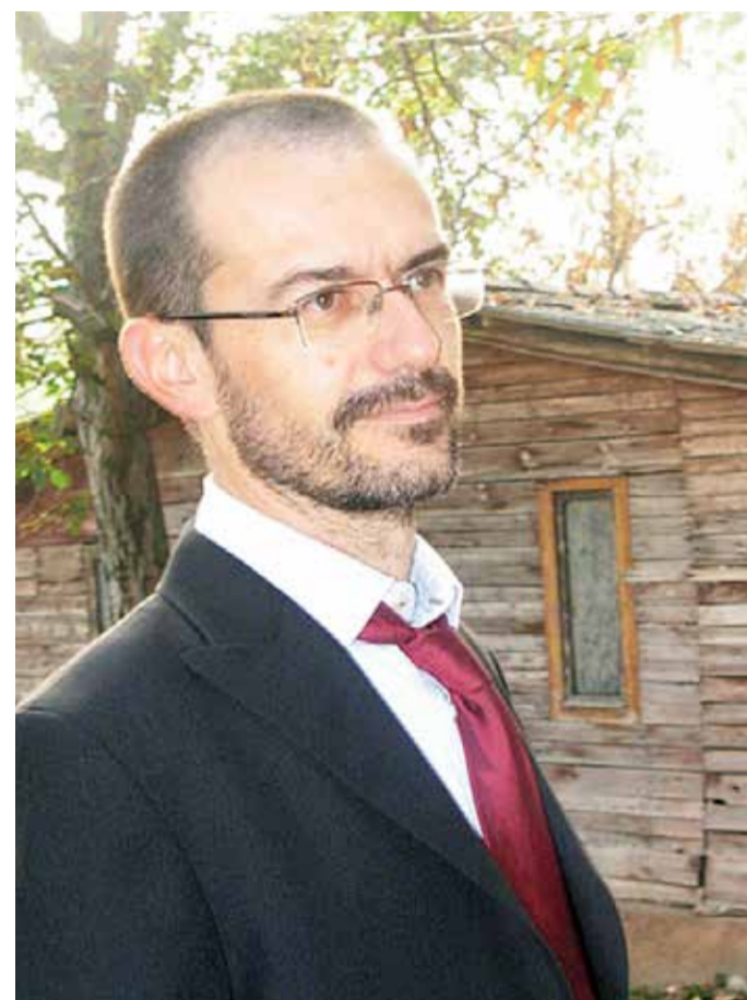
Sotto un'immagine del sindaco di Berlingo Dario Ciapetti, scomparso nel 2012, a 47 anni