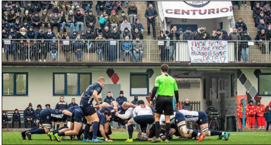
Il derby si è giocato all'Aso Stadium di Ospitaletto