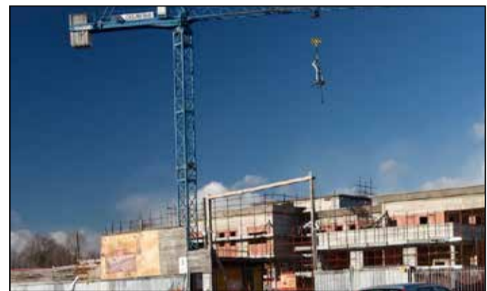
Il cantiere senza fine di Rovato, via Poffe

Chiediamo a Vizzardi di fare presto onde evitare di perdere un altro servizio, come già avvenuto per la guardia medica finita a Rovato». ■