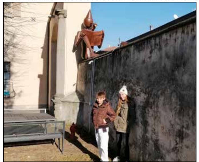
Due bambini in biblioteca sotto la magia di Pinocchio