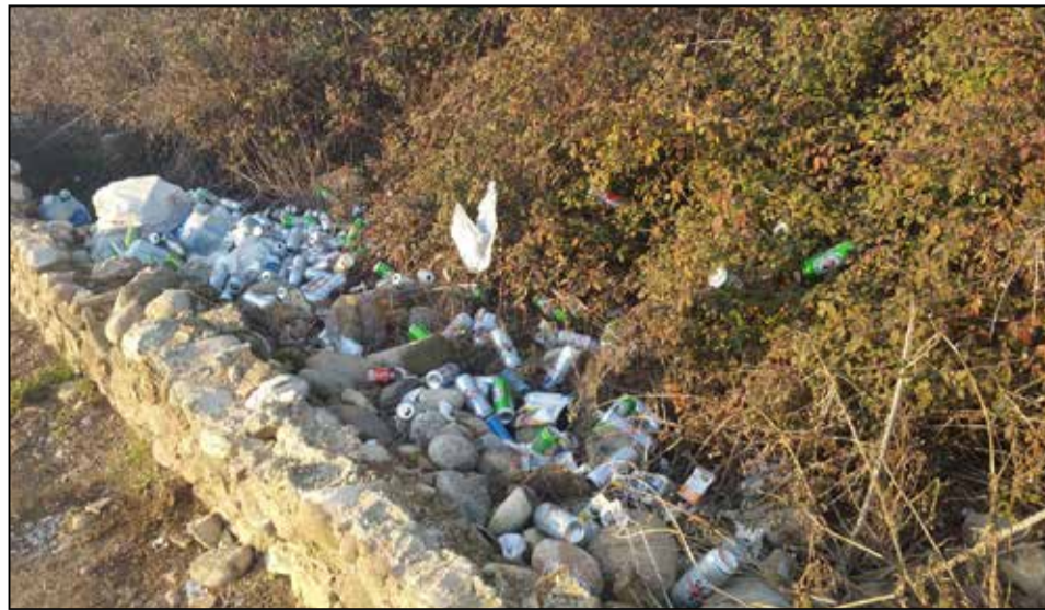
I rifiuti abbandonati in via Lucini