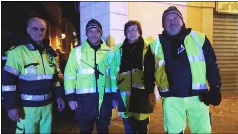
La Protezione Civile in servizio in piazza Cavour la notte del 31 dicembre