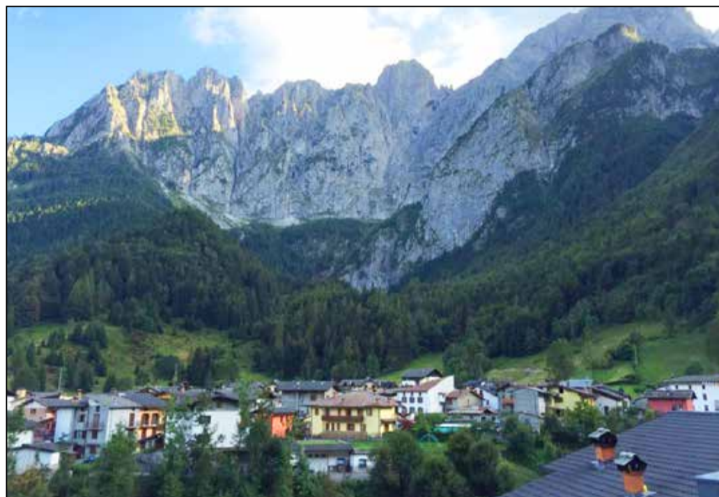
La Val di Scalve

Tel. 335.5877254 e-mail: infosportlab@gmail.com