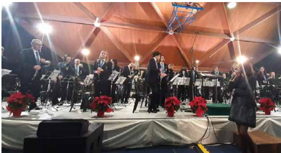
Il Civico Corpo Bandistico Luigi Pezzana nel tradizionale concerto natalizio