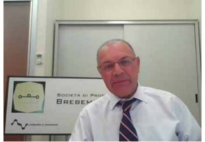
Il presidente di Brebemi Bettoni

Per i nuovi clienti aderire alle promozioni è semplice, basta seguire le istruzioni consultabili sul sito www.brebemi.it o chiamare il numero verde 800186083 o ancora rivolgersi al Punto Blu Assistenza Clienti, aperto dal lunedì al venerdì dalle 10:00 alle 19:30 e il sabato dalle 8:30 alle 13:00, presso il casello autostradale di Treviglio.