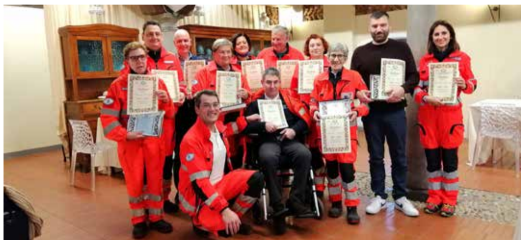
Alcuni dei premiati di Rovato Soccorso