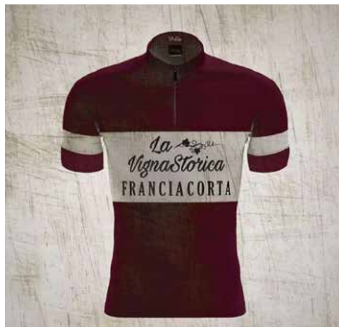
La prima edizione di Vigna Storica partirà da Rovato

Rendendo in questo modo possibile legare lo sport alla tradizione enogastronomica, con ristori lungo il percorso nelle cantine vinicole e nei borghi più rappresentativi della Franciacorta, ammirando così il paesaggio e degustando i prodotti tipici della nostra terra. ■