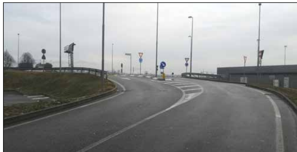
Via del Commercio: manca qualsiasi spazio di uscita ciclabile e pedonale per un'area shopping e ristorazione frequentata da centinaia di visitatori ogni giorno