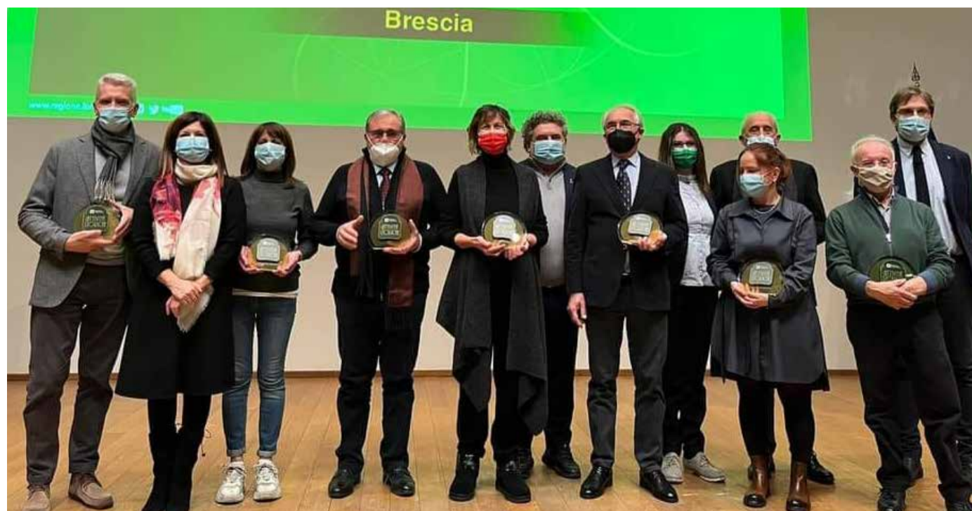
La premiazione delle attività storiche di Rovato avvenuta lo scorso 14 dicembre in Regione