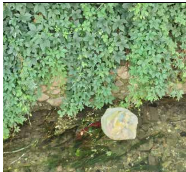
Rifiuti gettati nel canale in via Spalenza