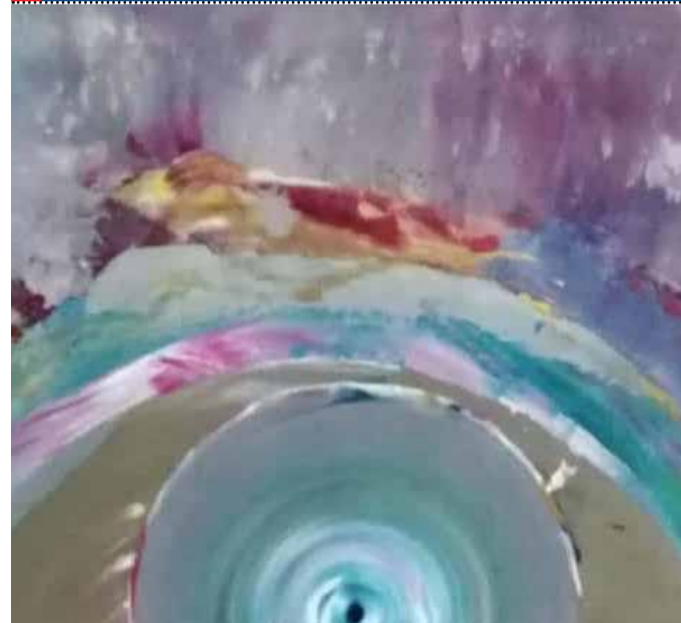
Cicli: genesi dei punti di vista Cm. 70x80 - Acrilico su tela