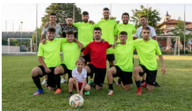
BESA (Comezzano) - Terza classificata