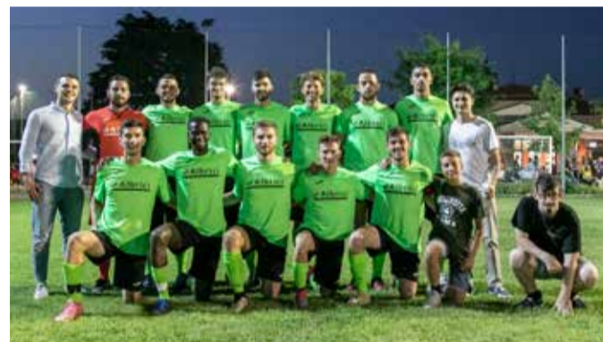
Albricci Meccanica (Coccaglio) - Seconda classificata