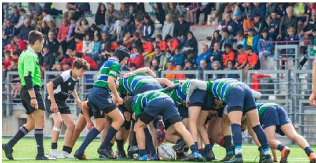
Torneo Città di Rovato, la finale Under 15. Franciacorta Vs Cus Milano