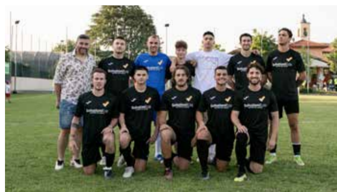
Soluzioni Edili (Capriolo) - Quarta classificata