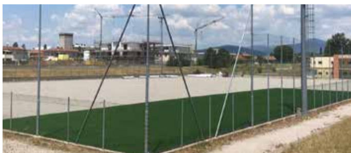
La posa del nuovo manto in sintetico al Campo Maggiore

dei Platani, dove la società ha la sua Club House, qui verrà sostituito il manto in sintetico. Un'opera da oltre 270mila euro partita a inizio giugno per evitare di creare problemi alla società in vista della nuova stagione: l'intervento ha visto la sistemazione dell'impianto di irrigazione, la posa della nuova canalina perimetrale, il ripristino di tutti i collegamenti idro-elettrici e stesa dello strato ghiaioso drenante in preparazione della posa del manto in sintetico. Proprio in questi giorni la ditta incaricata sta posando il nuovo terreno in sintetico. ■