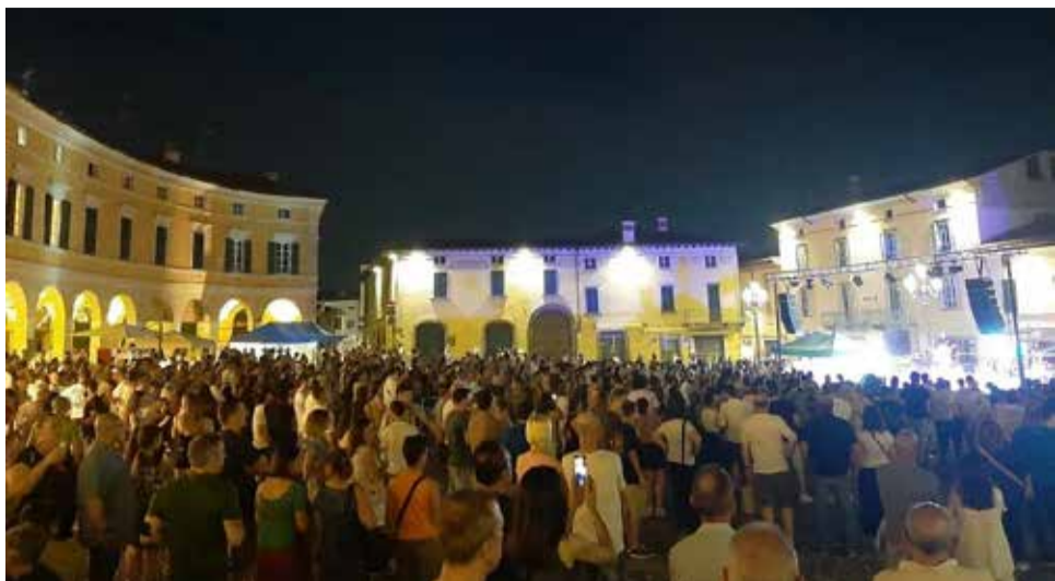
Un grande successo la notte bianca di Rovato svoltasi lo scorso 2 luglio