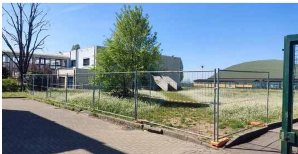
L'area dove verrà posto il nuovo corpo didattico