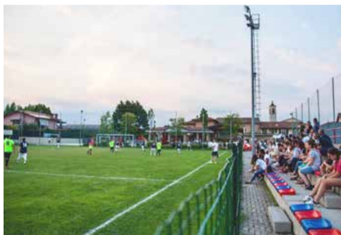
Il Memorial Salvi in una delle precedenti edizioni