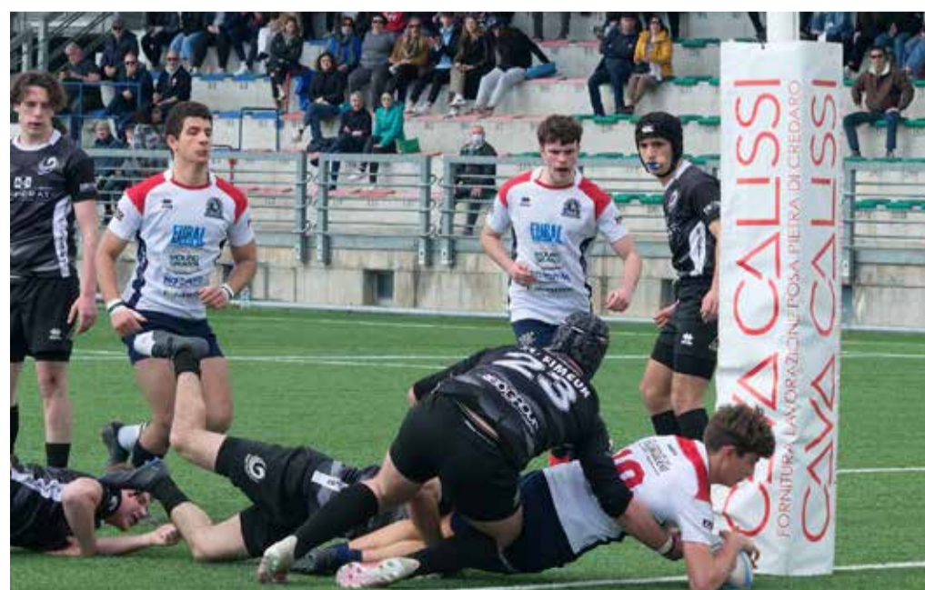
Under 19 Nordival Rovato 36 - Franciacorta 12. Meta di N. Furli