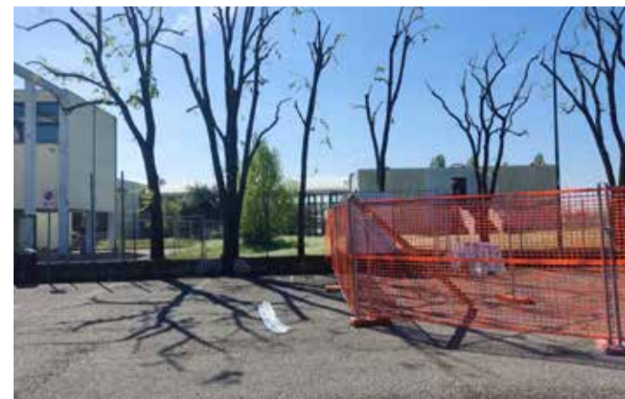
L'area del cantiere

notizia per l'Istituto rovatense, che oggi conta circa 1100 studenti iscritti, che continua così il suo percorso di crescita grazie al rafforzamento della sua offerta formativa ed è ormai diventato un punto di riferimento a livello di formazione per tutto l'Ovest Bresciano. ■