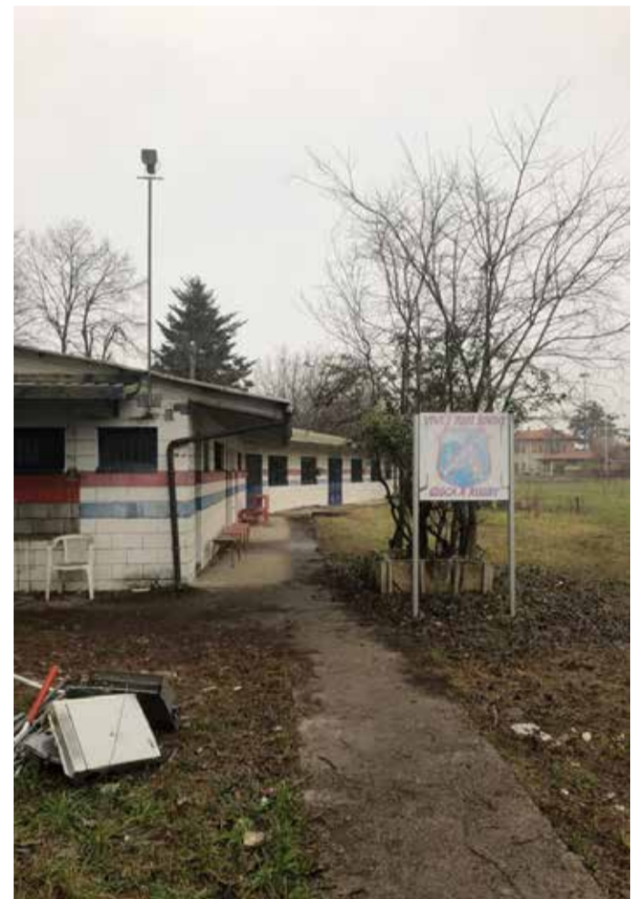
L'area sportiva di viale Europa prima dell'intervento di recupero