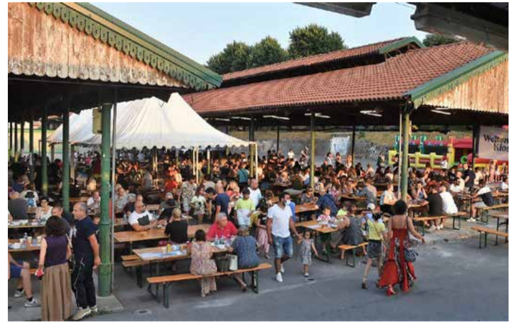
Numeri da record per la Festa Old

RESTAURO, LAVAGGIO, IGIENIZZAZIONE, RITIRO e CONSEGNA a CASA VOSTRA GRATUITI