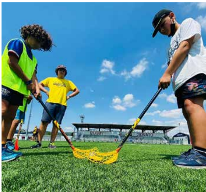
Multisport Camp, lezione di Lacrosse

rotti ad esempio) e dello sport, comprese molte squadre di calcio professionistiche: dalla Roma, al Chievo passando per l'Inter. Ora, per la prima volta, il lavoro dell'artista rovatense si tuffa in mischia. ■