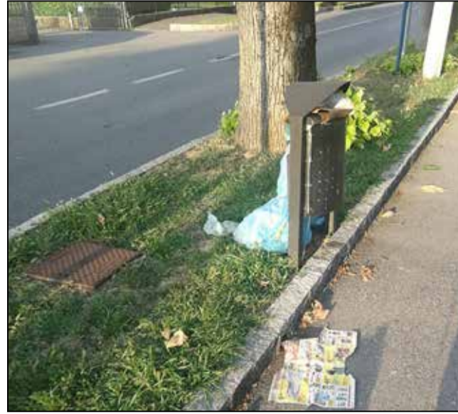
Rifiuti abbandonati da incivili in via Marconi