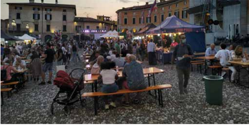
Grande successo per l'evento Rovato Street Food: musica e buon cibo in Piazza Cavour