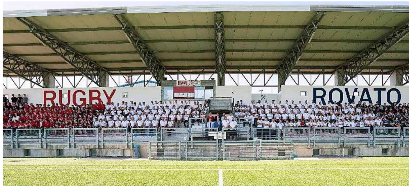
Come eravamo. Ottobre 2017