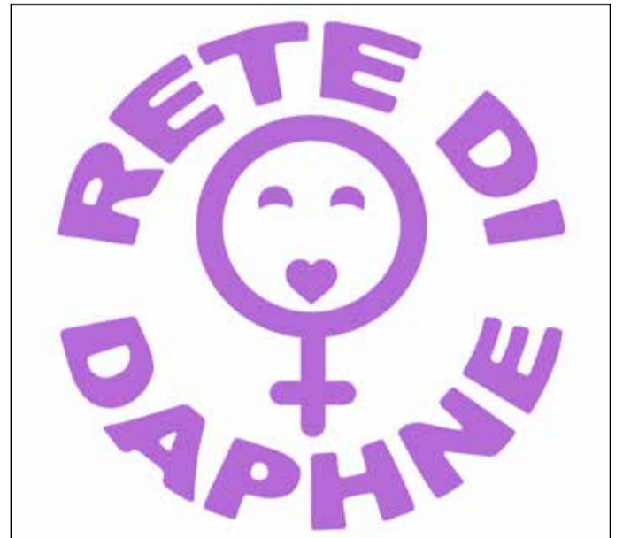
Il logo dell'associazione "Rete di Daphne"

golamento e le indicazioni per le opere da realizzare. Le opere donate saranno visibili sulle pagine social dell'associazione durante tutto il mese di novembre e vendute all'asta in occasione della Giornata Internazionale per l'eliminazione della violenza contro le donne, il 25 novembre. Il ricavato dell'iniziativa sarà devoluto a favore dell'ente e servirà a sostenere le attività del Centro Anti-violenza. ■