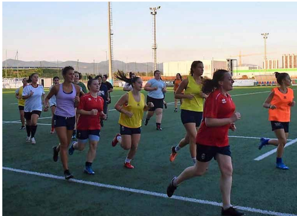
Anche le Queens Lilium sono tornate ad allenarsi

Personalmente ho sempre auspicato un cambio di marcia da parte della Federazione perché solo