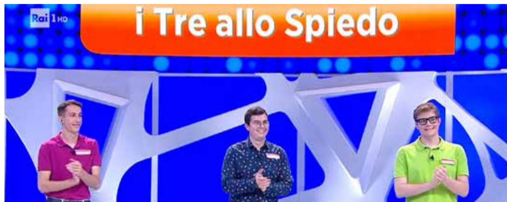
I tre rovatesi nel corso della puntata di Reazione a Catena

in carica, "I 90 e passa", aggiudicandosi lo spareggio dopo che entrambe le squadre avevano concluso la prova finale, l'intesa vincente, con lo stesso punteggio. Nell'arco delle nove puntate i tre giovani rovatesi sono riusciti per due volte a indovinare la catena finale vincendo un montepremi totale di 3.092 euro. ■