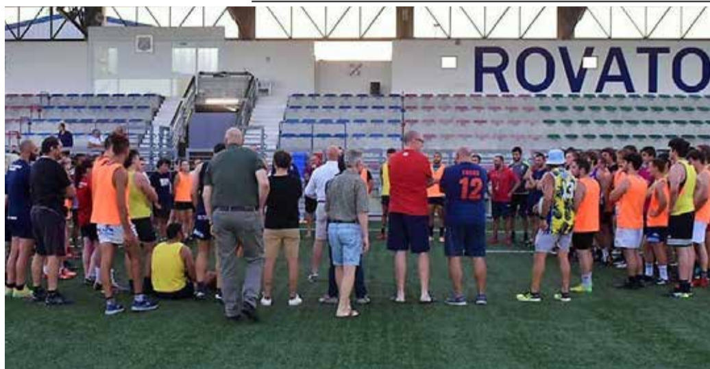
Dal 23 agosto Seniores e Under 19 sono tornati in campo