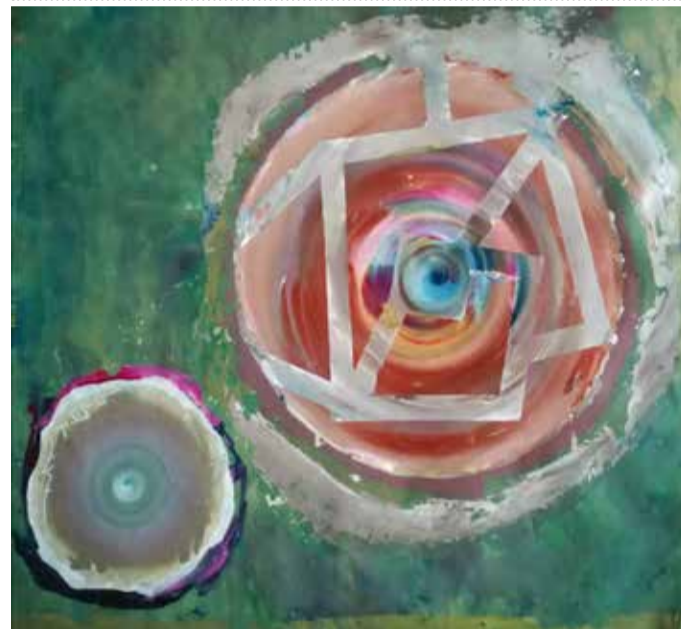
Labirintite (Acrilico su tela cm 70x70)