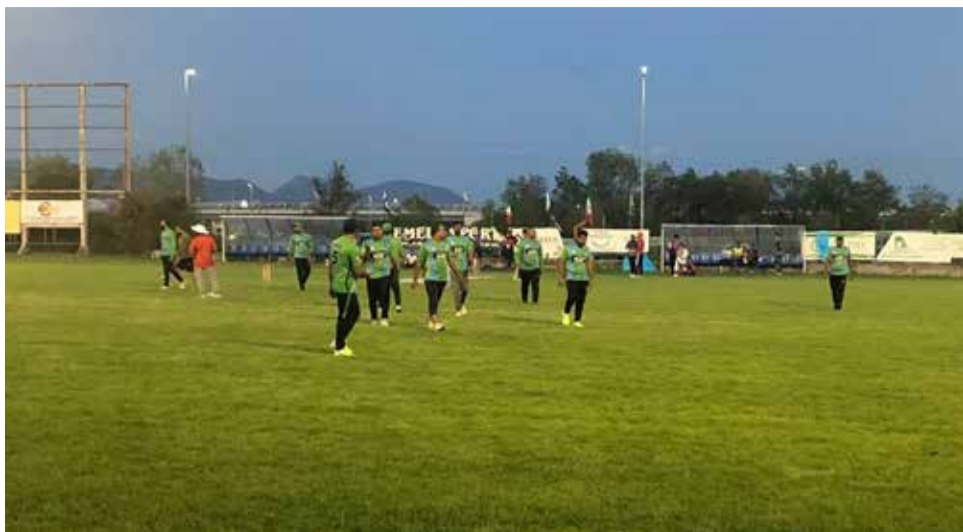
La seconda edizione del torneo di cricket di Rovato presso il campo Maffeis