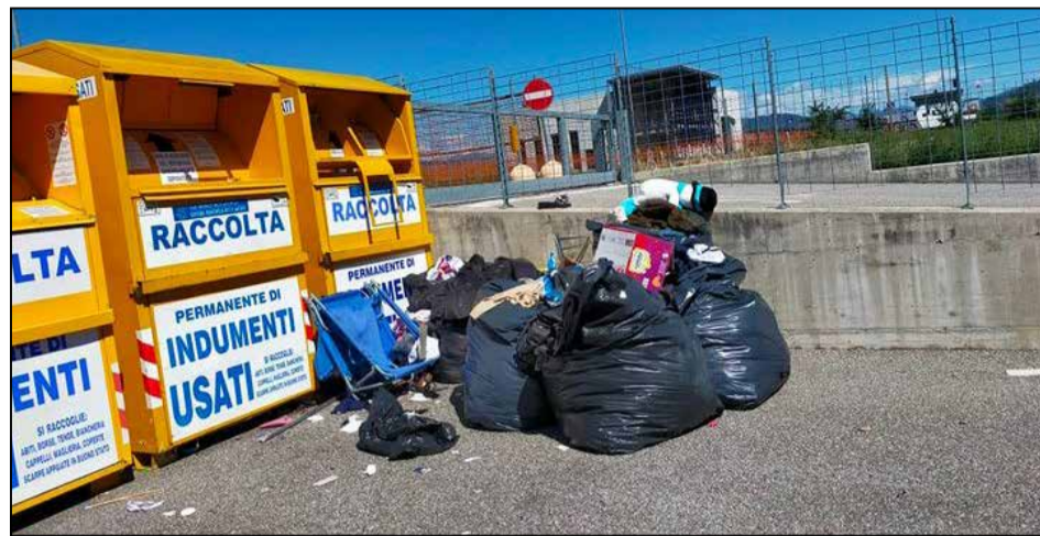
Rifiuti di vario genere abbandonati da incivili al punto raccolta indumenti