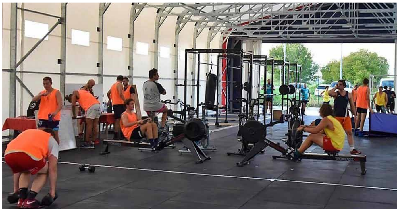
Un gruppo di Seniores e Under 19 impegnati con la preparazione fisica

così può crescere il movimento. In casa abbiamo la fortuna di poter offrire una preparazione adeguata a questo li-