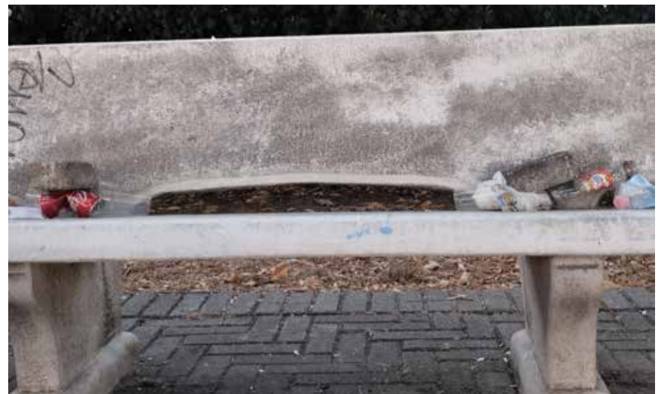
Bottiglie e rifiuti abbandonati su una panchina