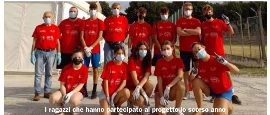
I ragazzi che hanno partecipato al progetto lo scorso anno