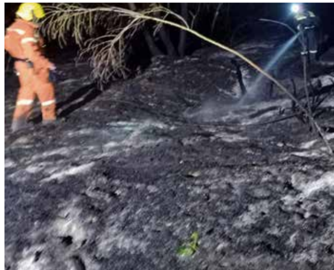
I vigili del fuoco al lavoro a Barco

volta ad essere interessata dalle fiamme è stata l'area di Barco. Da qui era arrivata la segnalazione da parte di un passante che ha notato il fumo e le fiamme alzarsi dalla vegetazione a sud della piccola frazione orceana. Immediato l'intervento dei Vigili del fuoco di Orzinuovi,