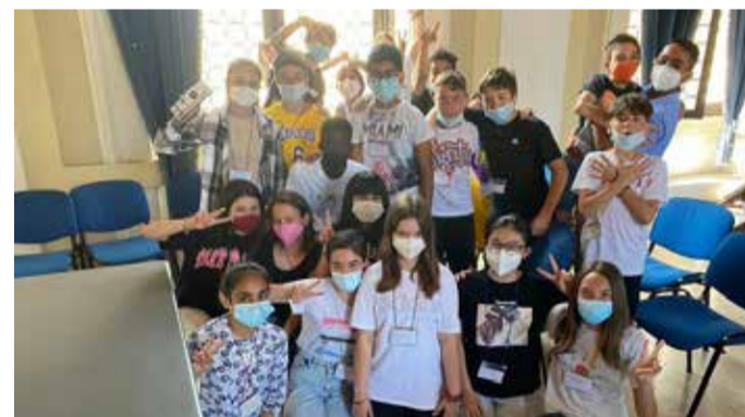
Gli studenti della 2ª B vincitori di Storie per Gioco