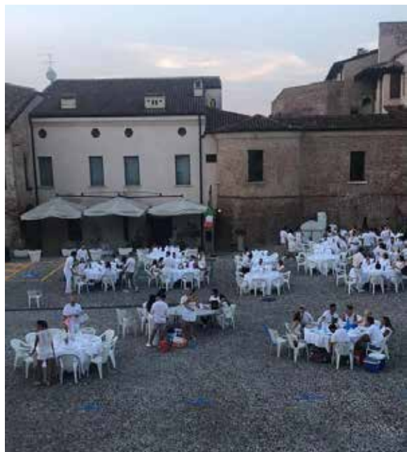
La Cena al chiaro di Luna in piazza Garibaldi