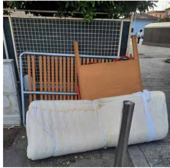
BRESCIA: rifiuti abbandonati in via Torino, angolo con via Fura