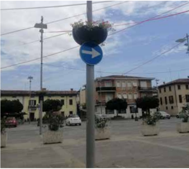
TRAVAGLIATO: La cura per i particolari in piazza Libertà. Questi vasi di fiori fanno la differenza