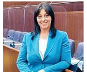
Il consigliere regionale leghista Francesca Ceruti