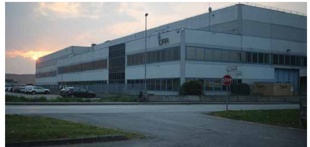
La Idra di Travagliato

Studio di architettura-ingegneria in Roccafranca cerca collaboratore con esperienza info@ingegneriacoccaglio.eu