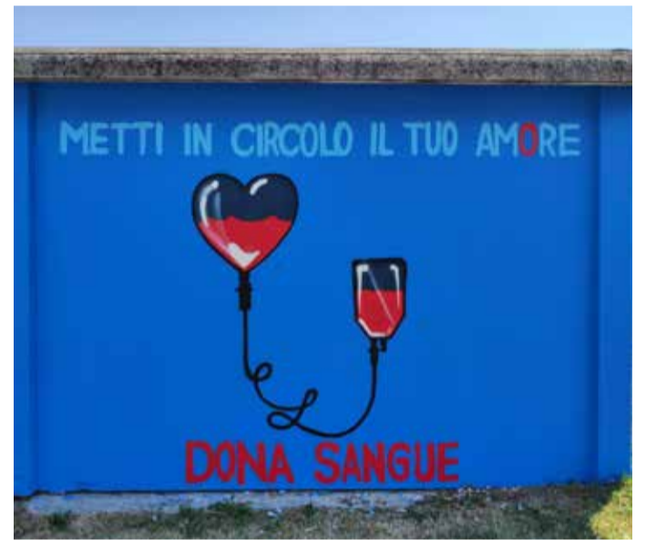
Il murales dedicato ai volontari dell'Avis