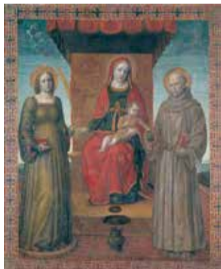
I due lati dello stendardo