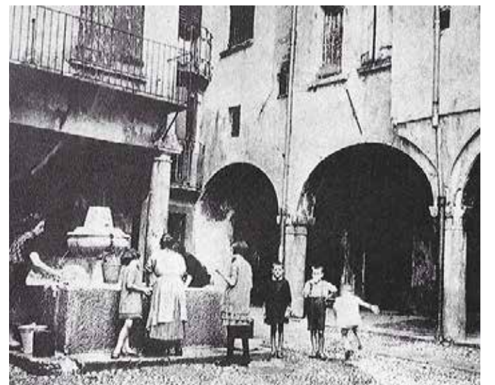
La corte della famiglia Polini

Adatte allo scopo erano le baldresche (logge poste all'ultimo piano delle case) che espongono le pelli al vento riparandole dal sole. ■