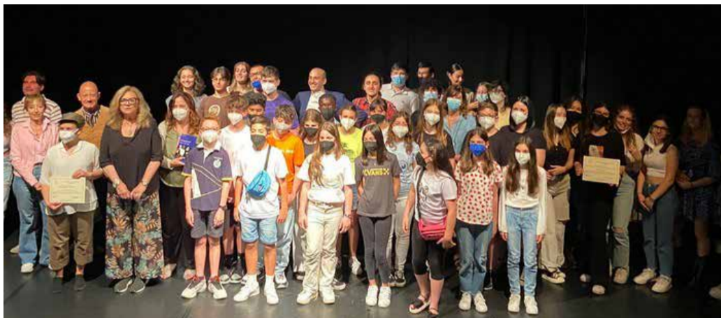
I ragazzi della 1ª C della secondaria premiati per il cortometraggio Odissea

Si sono aggiudicati il concorso "Facciamoci un corto"