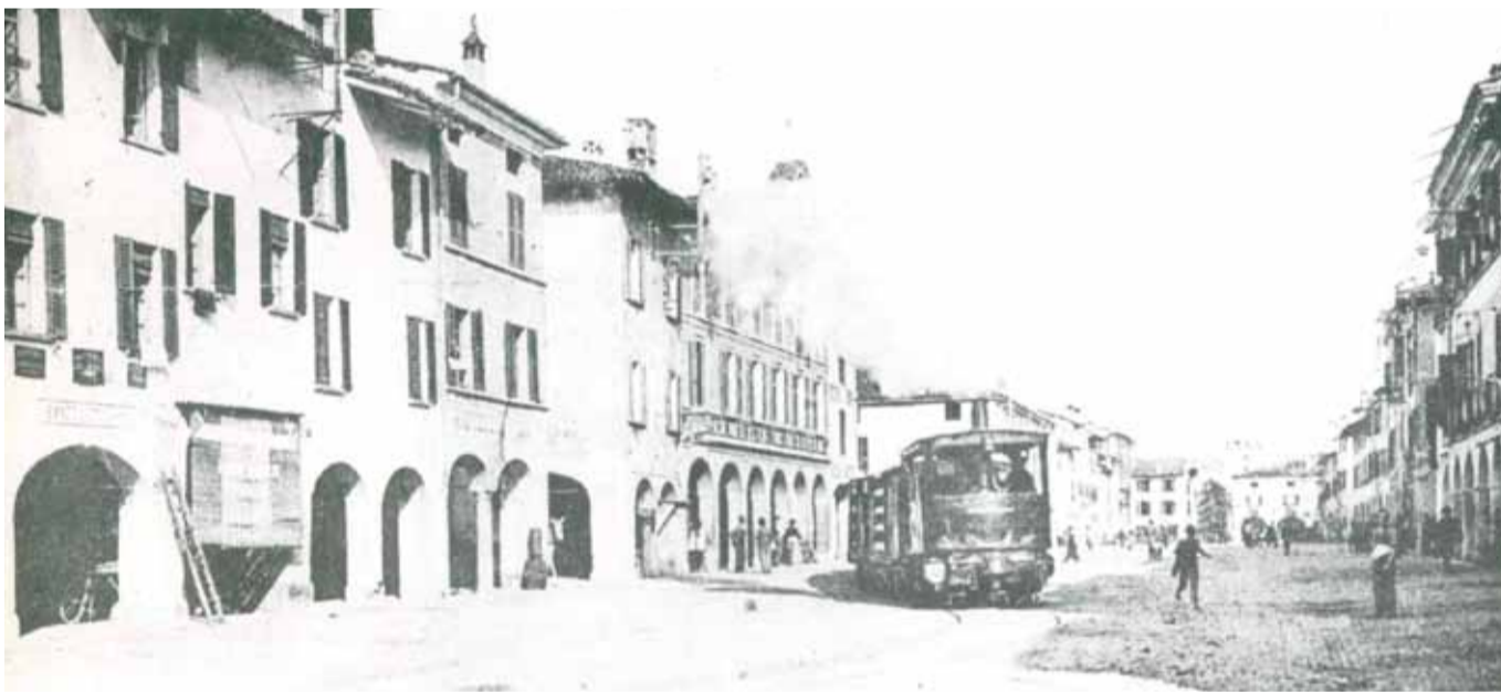
Fine Ottocento: il tram a vapore della linea Soncino-Brescia in piazza Cavour

L'EDICOLA DI VICTORIA Da noi puoi ritirare i mensili Under Brescia Il Giornale di Chiari