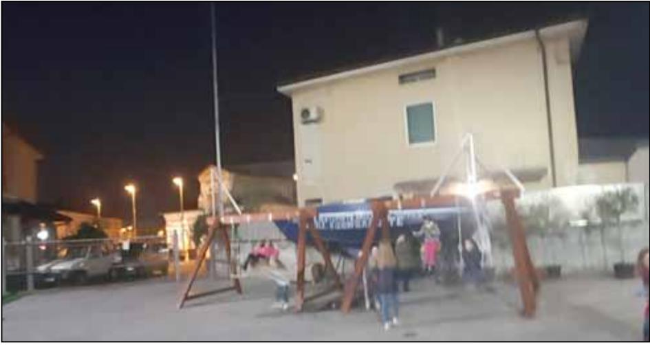
TORBOLE CASAGLIA: l'oratorio ha riavuto le sue altalene. Speriamo abbia perso i suoi vandali