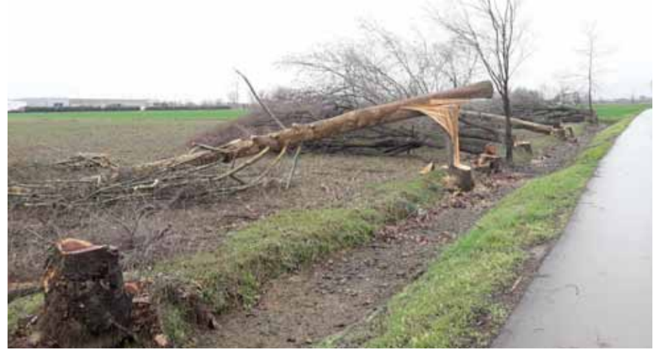
TORBOLE CASAGLIA: La paurosa tagliata di platani in Via crocefisso. Sono troppi e spesso ingiustificati i tagli di alberi nella nostra provincia