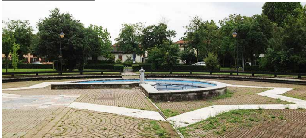
Il parco del Cono Ottico

sostituzione dei legni di seduta e schienale. L'Amministrazione comunale ha anche deciso di acquistare diciassette nuove panchine, che sono state posate al Cono ottico, alle Montagnette e nel Parco Inclusivo di via Dalla Chiesa, ed una trentina di nuovi tavoli, con base di ferro e piano in legno, che hanno sostituito quelli presenti e non più utilizzabili nelle aree Cono ottico, Montagnette, via Terracini, Falcone Borsellino, Parco inclusivo di via Dalla Chiesa, via Ribauda, via Mazzini. ■