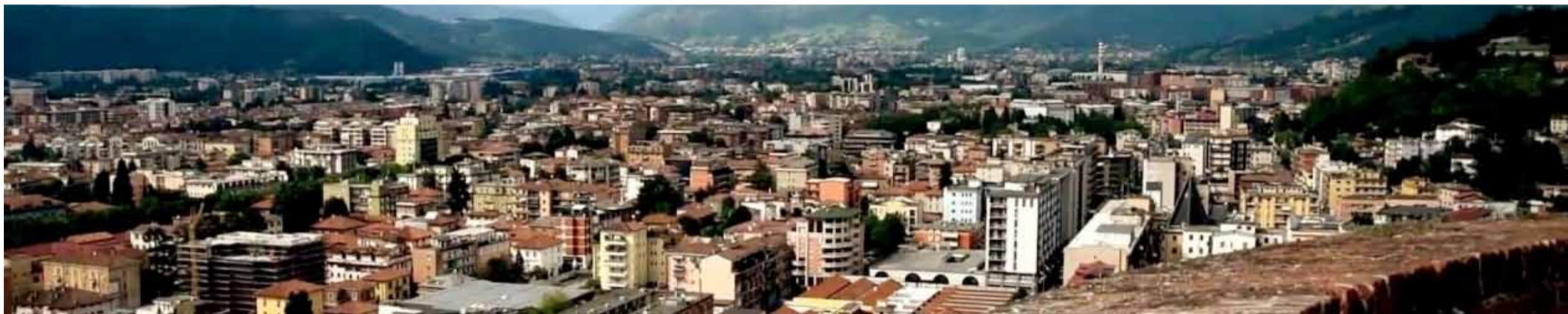
Panoramica sui tetti di Brescia

Stampa: Colorart, località Mole - Rodengo Salano (Bs) - Impaginazione: Magli & For You srl - Pubblicazione periodica registrata presso il Tribunale di Brescia - Autorizzazione numero 1 del 25 gennaio 2013 - Questa edizione è stata chiusa alle ore 14,00 del 7 Aprile 2018