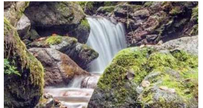
Il sentiero dell'acqua a Irma