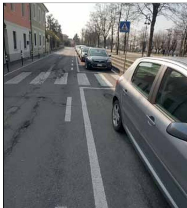
Via Filzi: questo attraversamento pedonale si chiama attraversamento cieco. Significa che un bambino, preso dalla sicurezza di poter attraversare sulle strisce, può correre fuori ed è impotente anche lo sfortunato automobilista che dovesse trovarselo davanti, anche se procede a bassa velocità. Questi attraversamenti vanno risolti oppure con la posticipazione verso la carreggiata delle strisce pedonali