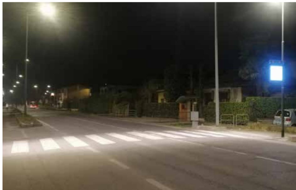
L'attraversamento pedonale di via Milano è stato illuminato