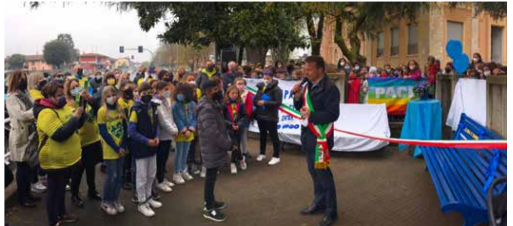
L'inaugurazione della panchina blu a Travagliato

Blu di Travagliato che hanno voluto che, accanto alla panchina, fosse presente anche una cassetta delle lettere, sempre colorata di blu, dove potranno essere imbucate richieste di aiuto e di informazioni. «Abbiamo inaugurato una panchina blu -si legge sul profilo facebook dell'Amministrazione comunale -, su iniziativa della 5 C della scuola primaria di Travagliato. I ragazzi hanno dipinto con le loro mani questa panchina che è diventata uno strumento per sensibilizzare tutti sull'importanza di ricordarsi delle persone con autismo. Un bellissimo gesto da parte loro e da parte degli insegnanti. Grazie per questo e per i momenti di riflessione dei