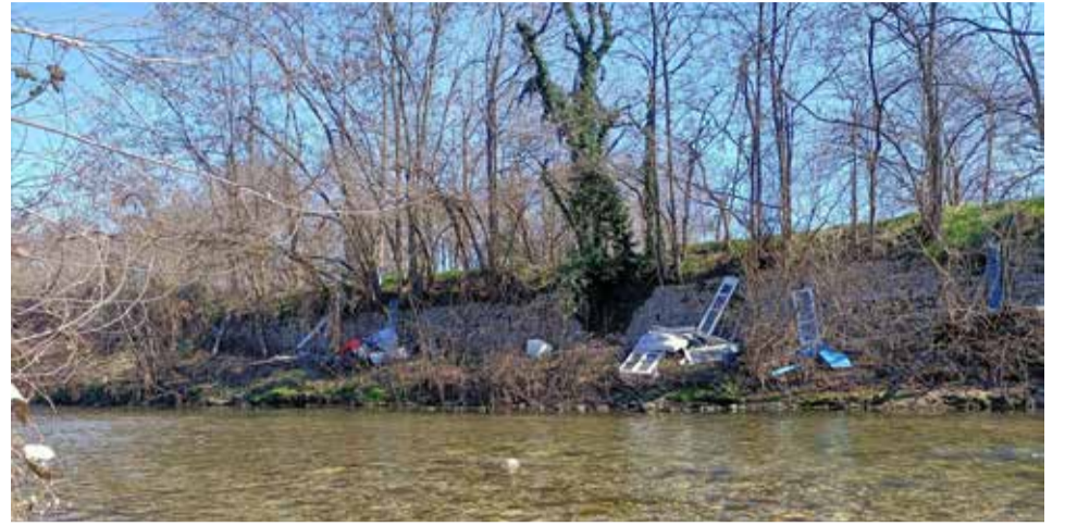
BRESCIA: rifiuti di ogni genere abbandonati ormai da mesi lungo il fiume Mella in via Orzinuovi