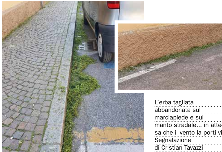
L'erba tagliata abbandonata sul marciapiede e sul manto stradale... in attesa che il vento la porti via Segnalazione di Cristian Tavazzi