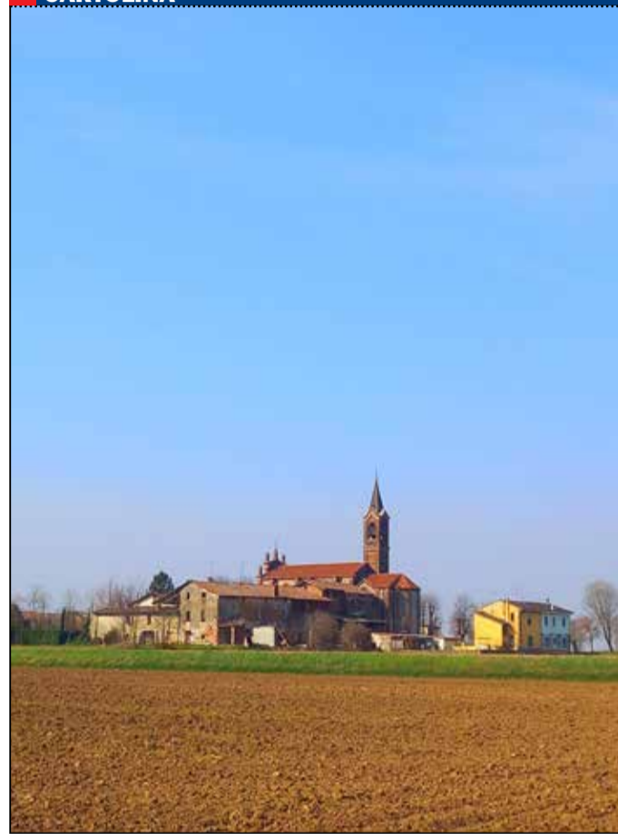
Pudiano di Orzinuovi