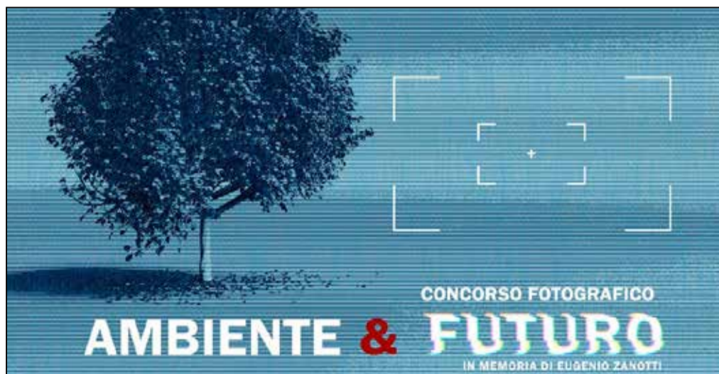
La locandina del concorso fotografico