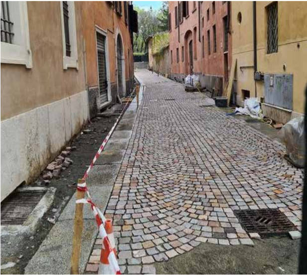
BRESCIA: lavori di riqualificazione in Via Musei