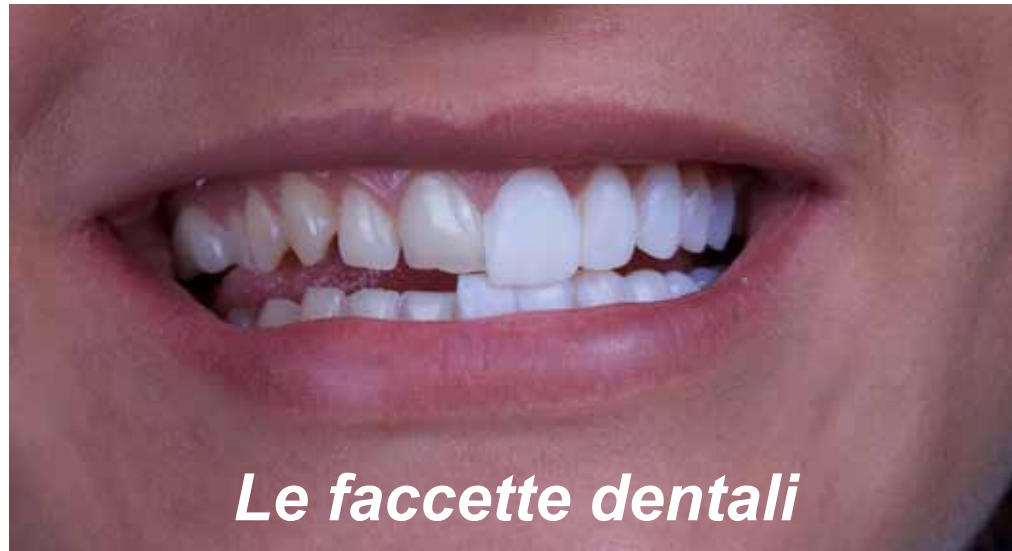
Le faccette dentali