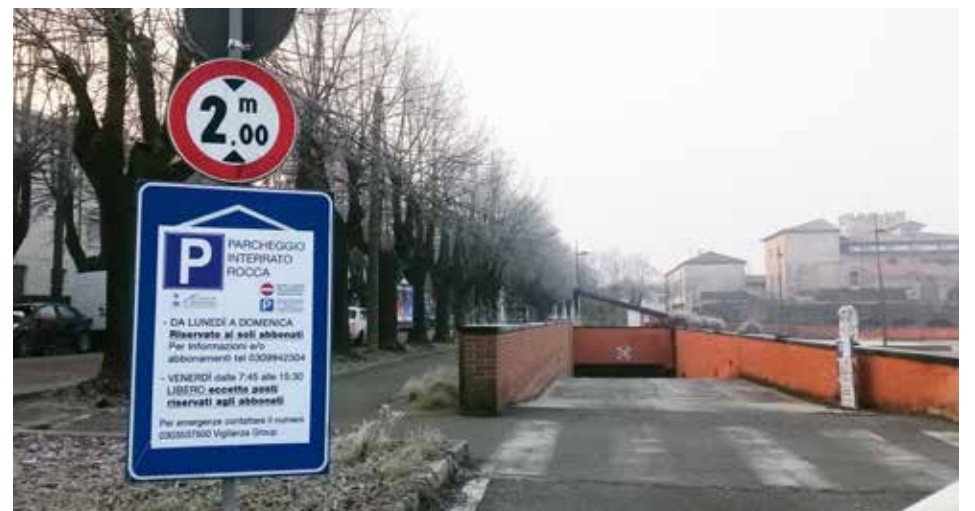
Il parcheggio interrato della Rocca riservato ai soli abbonati per 200 euro all'anno. Tante le segnalazioni che abbiamo ricevuto per riportare nuovamente davvero pubblico questo spazio, già assai molto discusso dal punto di vista urbanistico. Oggi chi arriva senza abbonamento non vi può parcheggiare