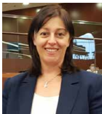
Il consigliere regionale leghista Francesca Ceruti

Ceruti (Lega): «Questione importante che non può più essere rimandata: lo Stato partecipi alla spesa per non dimenticare né i minori né i Comuni, che sono in affanno»