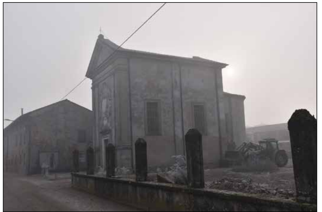
Il magnifico oratorio di San Bernardo alla Cesarina, località antichissima tra Orzinuovi, Orzivecchi e Roccafranca