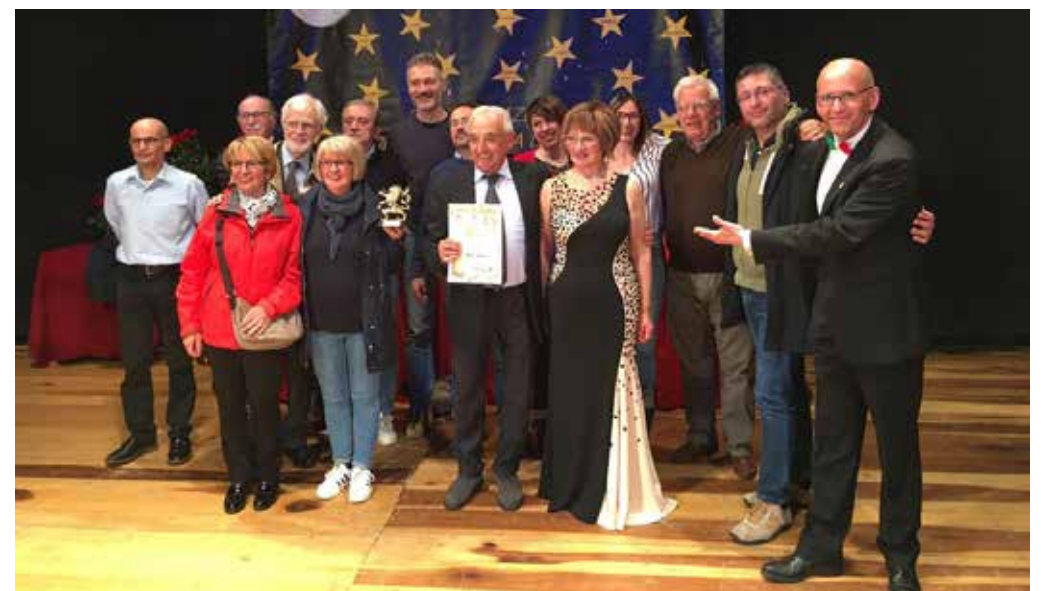
I vincitori dell'ultima edizione della Leonessa d'Oro, la compagnia Il Siparietto di Casalpusterlengo