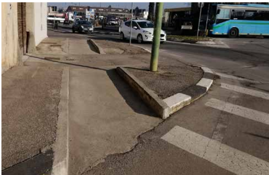
Il passaggio ciclopedonale ricavato a nord del parcheggio Rocca