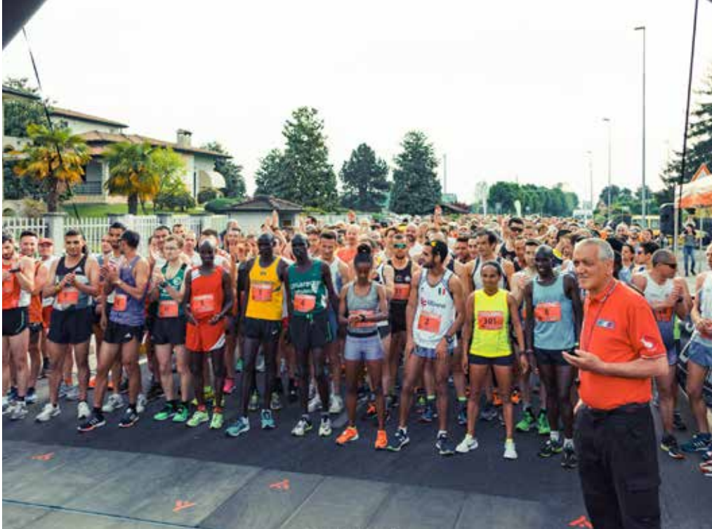
La partenza della manifestazione del 2018