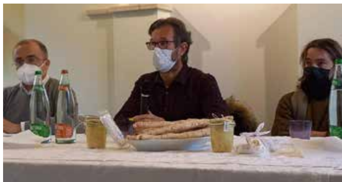
Carlo Cracco a Soncino

Offrite lavoro ma non trovate chi cercate da tempo? La nostra rubrica