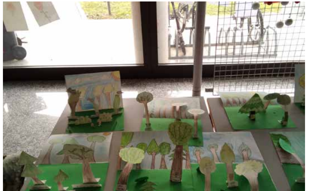
I lavori degli studenti per la celebrazione del Giorno della Memoria