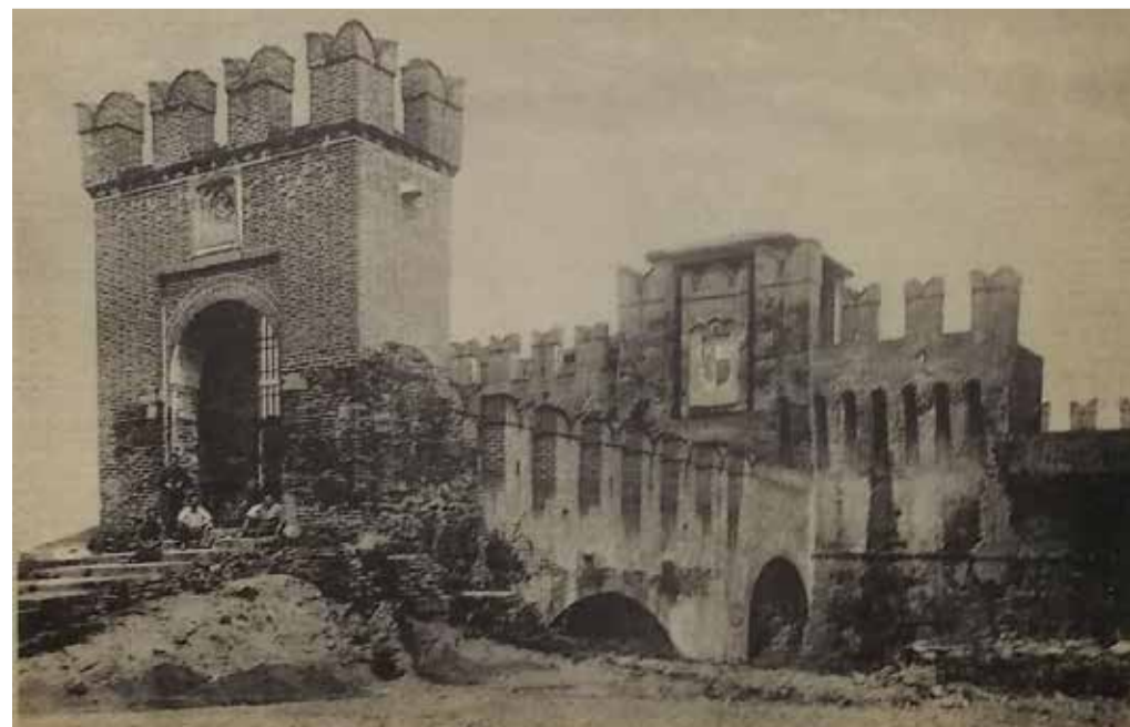
Il castello in uno scatto del 1949