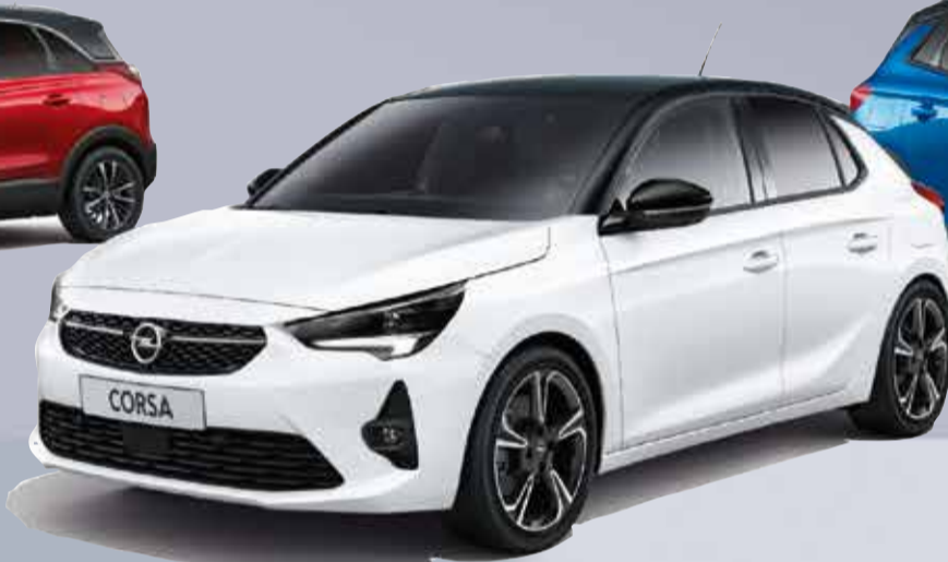
CORSA anche 100% elettrica