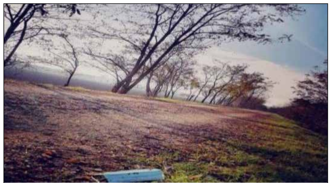
Una delle foto con cui Taglietti ha accompagnato il proprio lavoro