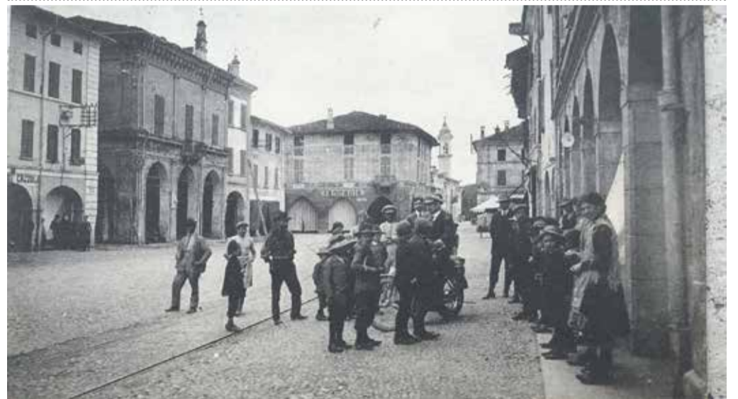
L'odierna piazza Vittorio Emanuele II affollata nel 1918

L'EDICOLA DI VICTORIA Da noi puoi ritirare i mensili Under Brescia Il Giornale di Chiari