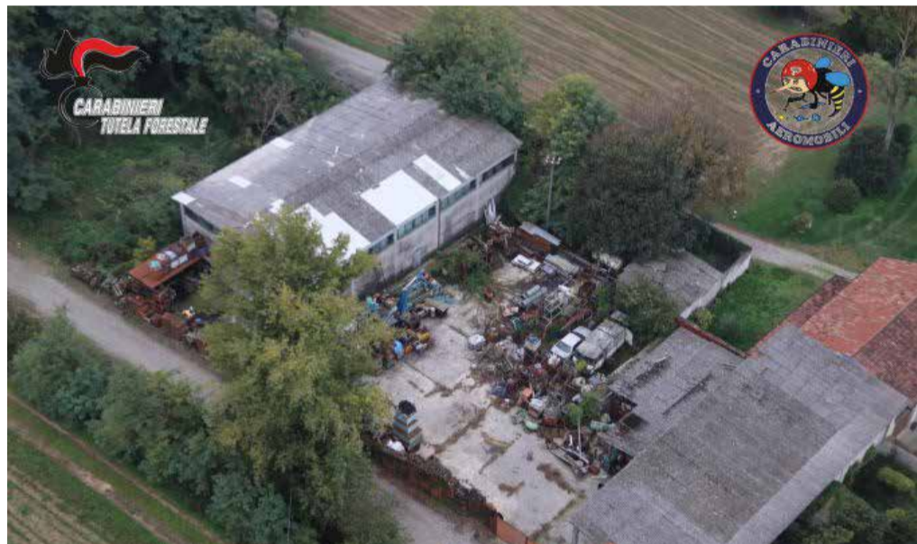
La discarica abusiva di Orzinuovi

bandono, batterie al piombo usate, elettrodomestici fuori uso, serbatoi di GPL e gasolio, rifiuti metallici e plastica. La Prefettura ha anche spiegato che non è escluso che nell'area ci sia la presenza di amianto, per questo è stato allertato il Centro Regionale Microscopia Elettronica di Arpa Lombardia per eseguire gli approfondimenti analitici del caso. ■