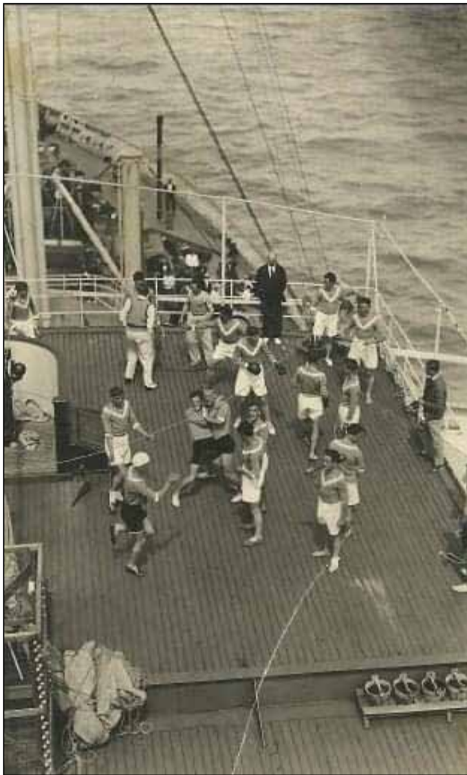
Luglio 1928: il Brescia Football Club sulla motonave Duilio diretta in Nord America per una tournée