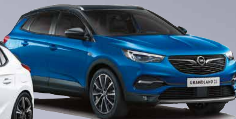
GRANDLAND X anche Ibrido Plug-In