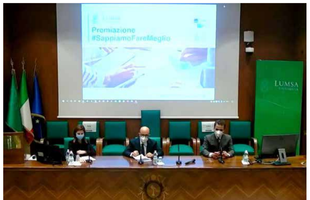
Un momento della premiazione Lumsa