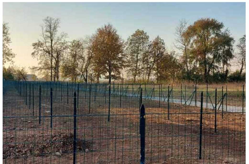
L'area degli orti comunali in attesa del bando per l'assegnazione degli spazi

ambiente adeguato e protetto. Inoltre, è stato creato un orto più grande destinato alla scuola, perché i ragazzi imparino sin da piccoli che la terra, se ben coltivata, dà buoni "frutti"; questo progetto-chiosa Bonfiglio- costituirà un ulteriore strumento di aggregazione, in quanto coinvolgerà tutti gli alunni, italiani e stranieri, che potranno trovare una nuova occasione di condivisione». ■