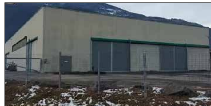
I capannoni di una delle società sotto inchiesta

utilizzato per il pagamento della merce fornita "in nero". Il profitto dell'associazione criminale è stato quantificato nel 10% dei 57 milioni di euro di fatture false. Al termine delle indagini, il Pm titolare delle indagini, tenuto conto della gravità delle condotte, ha chiesto ed ottenuto dal Gip del Tribunale di Sondrio l'emissione dell'ordinanza di applicazione delle misure cautelari personali nei confronti degli 8 indagati, 4 in carcere e 4 agli arresti domiciliari, tutti residenti nel Bresciano. ■