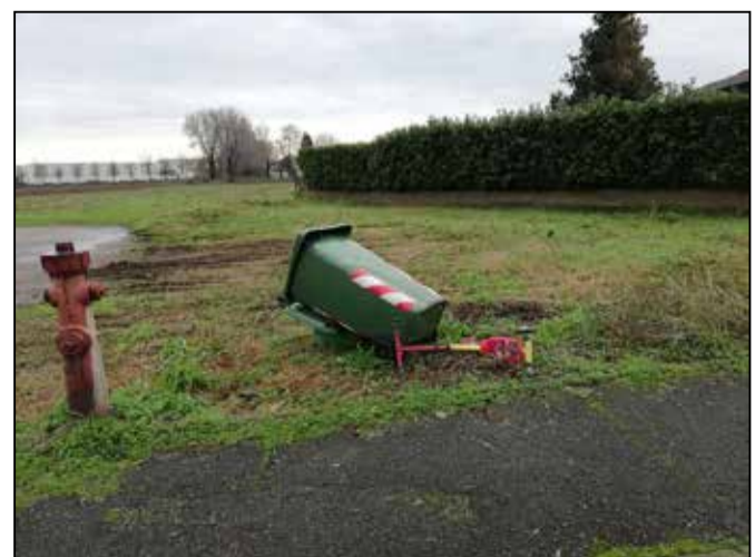
Da giorni cassonetto e un monopattino sono abbandonati insieme a un sacco della spazzatura in via F. Margola.

E' evidente che il servizio di netturbino vada migliorato assieme a quello di video sorveglianza