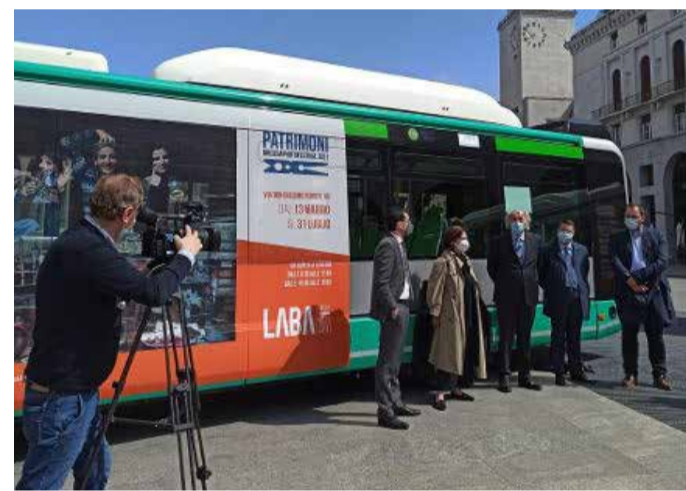
Uno degli autobus “vestiti” dagli studenti della LABA

ai bresciani strumenti che li aiutino ad apprezzare la bellezza che li circonda e a fare patrimonio condiviso». ■