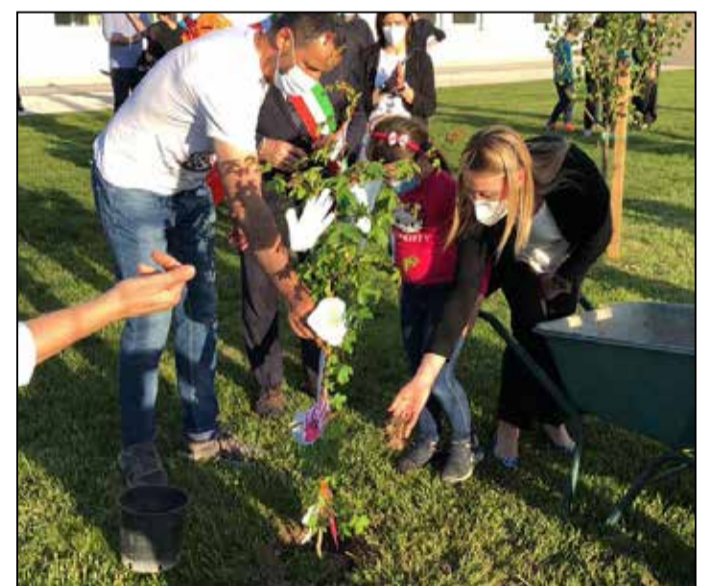
La piantumazione ad Orzinuovi

L'EDICOLA DI VICTORIA Da noi puoi ritirare i mensili Under Brescia Il Giornale di Chiari