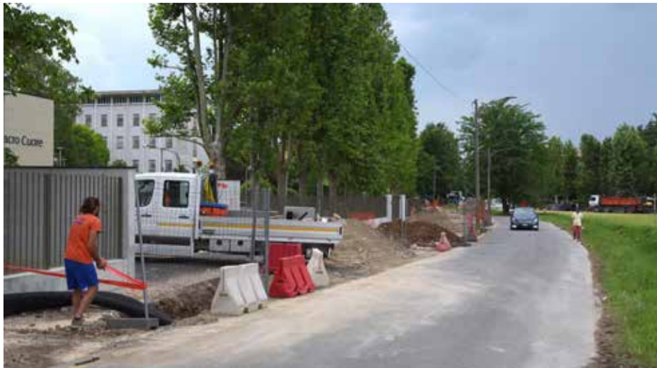
BRESCIA: i lavori per la realizzazione del nuovo percorso ciclopedonale che collega via Branze e via Garzetta