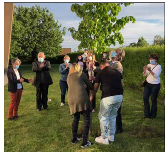
La piantumazione nel giardino della sede della Cooperativa in via Vecchia