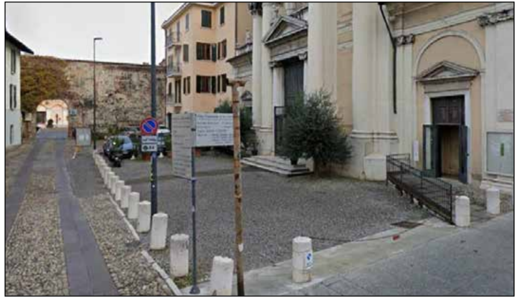
Il muro "sopravvissuto" visto dalla parte della chiesa di San Lorenzo

private. La chiesa scompare del tutto. Unico superstite della chiesa è il muro perimetrale che la delimitava a sud, muro che oggi separa il sagrato della chiesa di San Lorenzo da piazza Bruno Boni. La muraglia, aperta solamente dall'ampio portale che permette oggi il passaggio, è caratterizzata da una tessitura caotica di mattoni e conci di pietra locale, chiaramente molto antica. Si scorgono inoltre tracce delle antiche finestre, ormai schermate. Alla fine del Novecento l'area dello scomparso monastero viene interessata dal progetto di riqualificazione della corsia del Gambero, progetto che porta all'inaugurazione, nel 1998, di piazza Bruno Boni, ricavata occupando lo slargo da tempo dismesso. ■