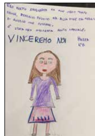
Uno dei disegni realizzati dai bambini delle elementari di Travagliato in occasione del tampone «lecca-lecca»

Il direttore generale di Ats Brescia Claudio Ats si è detto altrettanto soddisfatto: «Sia chiaro non è una rivoluzione dei tempi di laboratorio ma delle modalità di prelievo dei campioni. Perché i tempi per il referto restano pressoché uguali. Non è escluso che in futuro, aumentando laboratori sul territorio, le tempistiche non possano restringersi, ma, ripeto, prima delle 12-24 ore è per ora impensabile avere un riscontro. Quanto all'attendibilità, ricordo che si tratta di un test molecolare per cui è pressoché identico a quello nasofaringeo ma con vantaggi palesi a tutti». ATS Brescia ha organizzato e dato il via alle iniziative di testing in 3 scuole, per un totale di 11 classi. Oltre a Travagliato, sono state coinvolte anche 3 sezioni della materna Pasquali di Brescia (18 maggio e 1 giugno) e 3 sezioni della media inferiore di Roncadelle (19 maggio e 3 giugno).