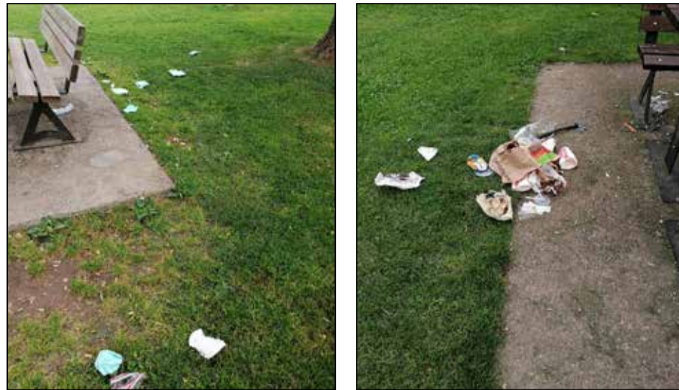
BRESCIA: rifiuti abbandonati al Parco Biagi