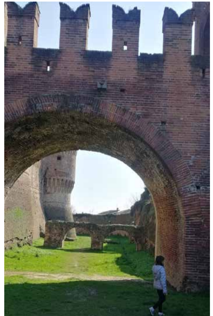
Il suggestivo passaggio nel fossato del castello sforzesco