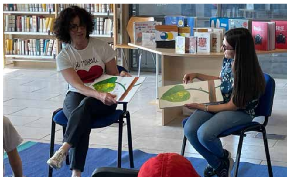
Le letture per i più piccoli del Gruppo Contastorie e delle mamme collaboratrici madrelingua in ucraino, arabo, tedesco, spagnolo, albanese