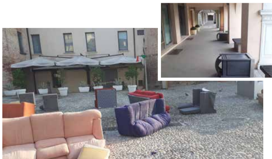
Gli atti di vandalismo che si sono registrati nei giorni scorsi in piazza Vittorio Emanuele II e in piazza Garibaldi