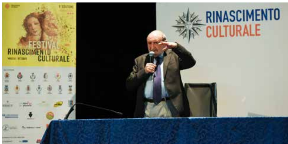
Rinascimento culturale: la tappa di Flero con il filosofo Umberto Galimberti