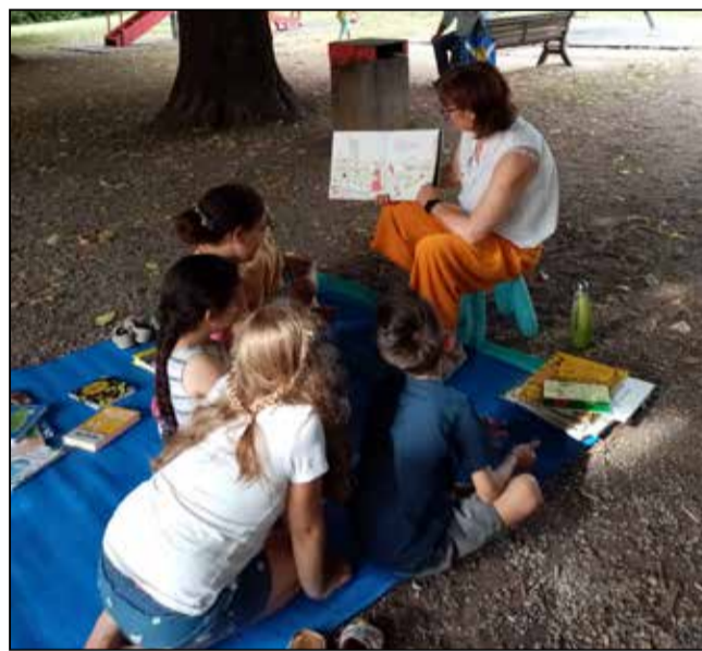
Le letture dei più piccoli al parco comunale

Un'iniziativa promossa per avvicinare ancor di più la biblioteca comunale ai suoi utenti. ■