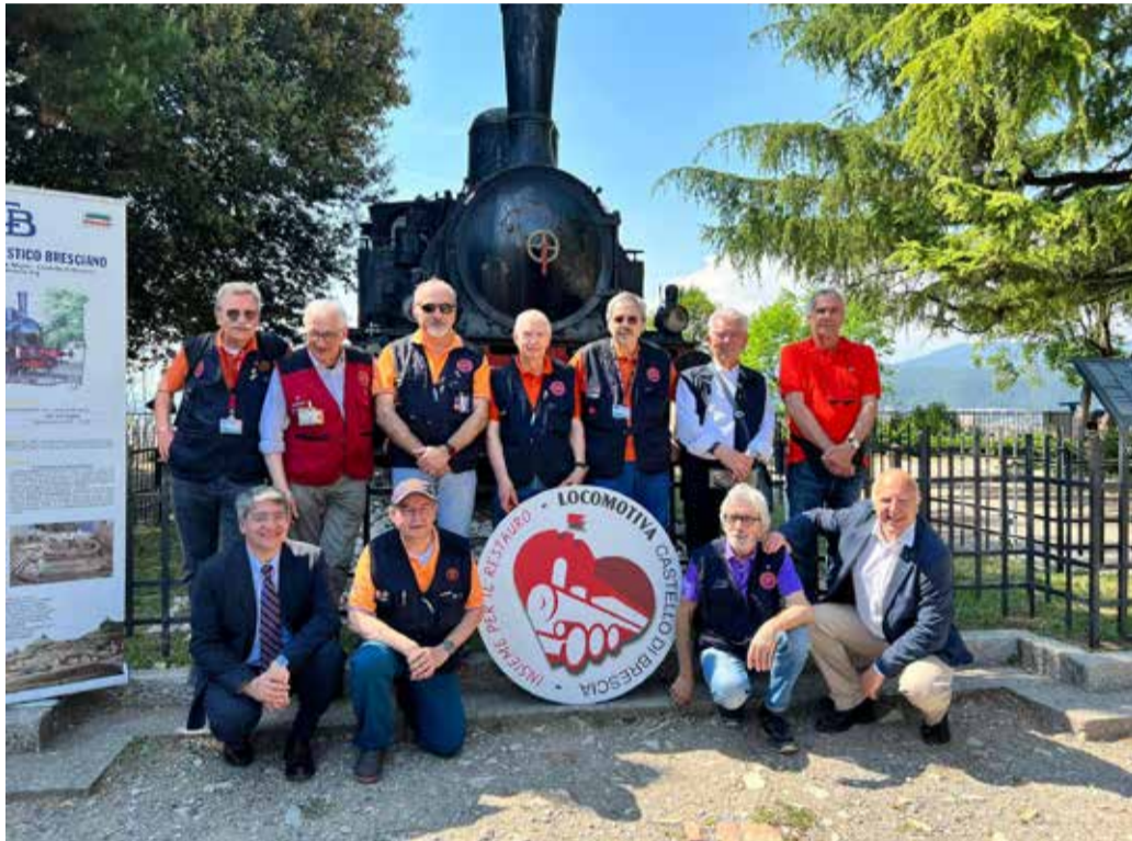
La locomotiva e il logo dell'iniziativa

Non solo, complesse furono anche le operazioni per far passare il convoglio sotto il portone di accesso del Castello, che fu letteralmente smontato, e per superare l'ultima strettissima curva che portava al piazzale. Per farlo fu coinvolta la sovrintendenza alle Belle Arti di Brescia visto che si dovette temporaneamente tagliare l'antico rosone di ferro che sovrastava il secondo portone di accesso al Castello, poi ripristinato. ■