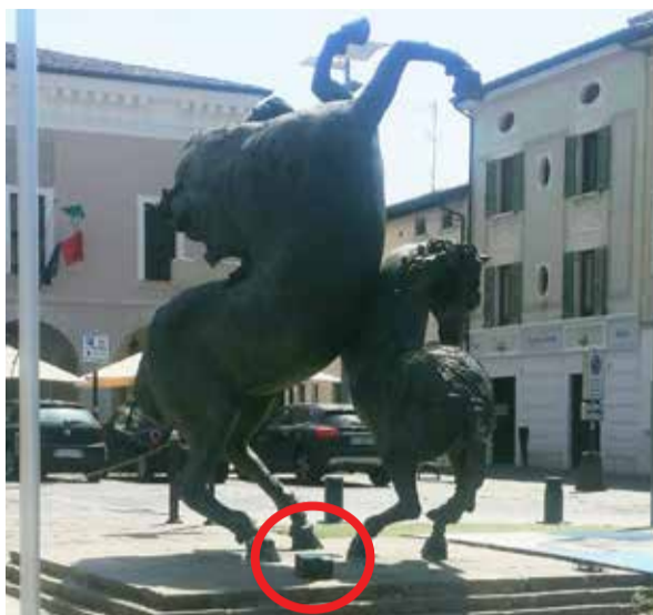
TRAVAGLIATO: decisamente inopportuno mettere una trappola per roditori sotto alla statua equestre di Piazza Libertà