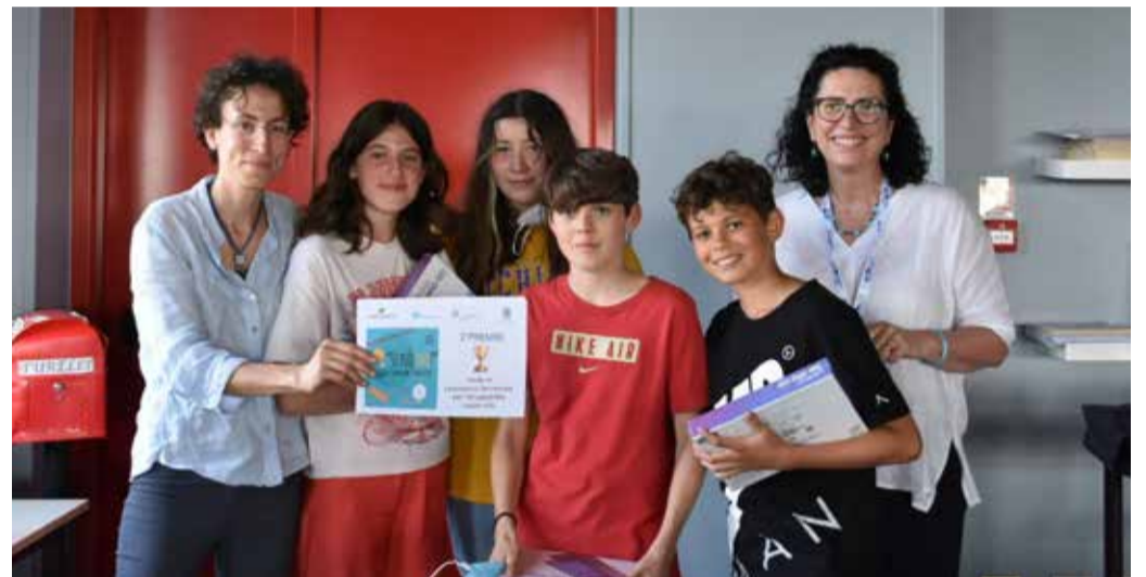
Gli studenti della 2ª D, vincitori del premio