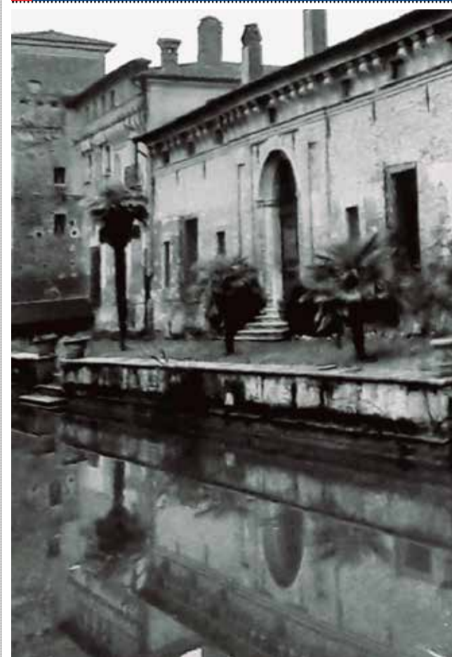
Il Castello di Padernello di Borgo San Giacomo: "Con un castello cinto sui fianchi et fosse col suo ponte levador comodissimo di stanza per li Signori". Così scriveva nel 1610 il Lezze