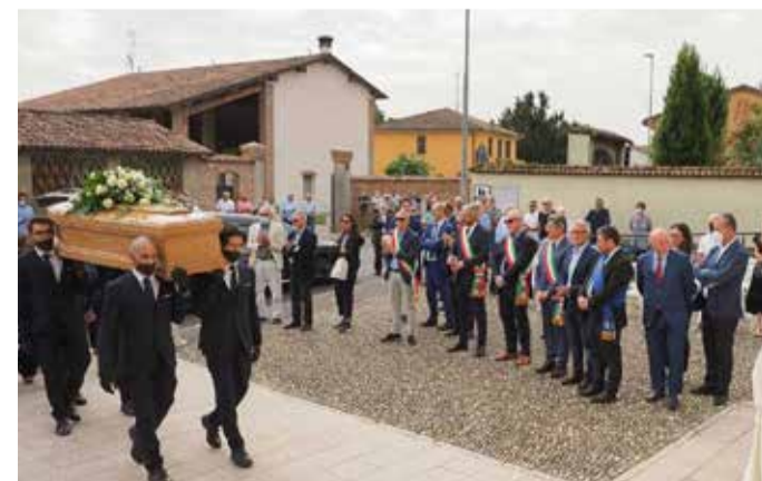
L'arrivo del feretro in parrocchiale