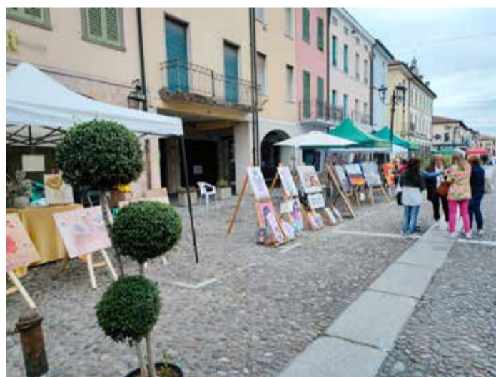
"L'arte è donna" è sbarcata in piazza Vittorio Emanuele