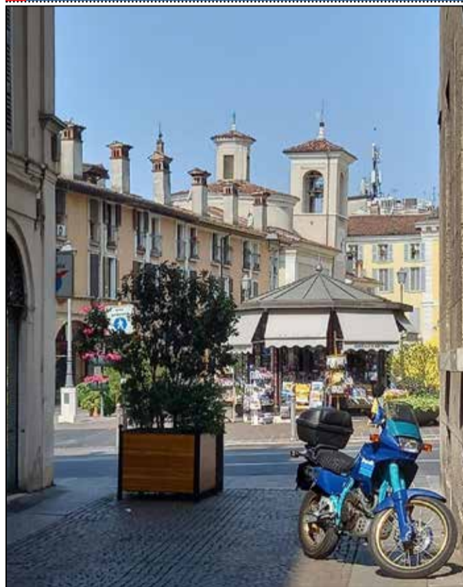
Saluti da Brescia