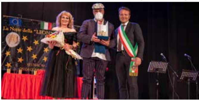
Un momento delle premiazioni