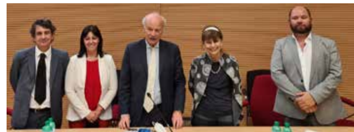
La presentazione del bando Tutori MSNA

Il bando è stato pubblicato sul BURL "serie avvisi e concorsi" il 23.02.2022 e potranno presentare la domanda, che si trova anche sul sito del Garante per l'Infanzia e l'Adolescenza di Regione Lombardia ( www.garanteinfanzia.regione.lombardia.it ), tutti coloro che hanno i requisiti entro il 23.08.2023. ■