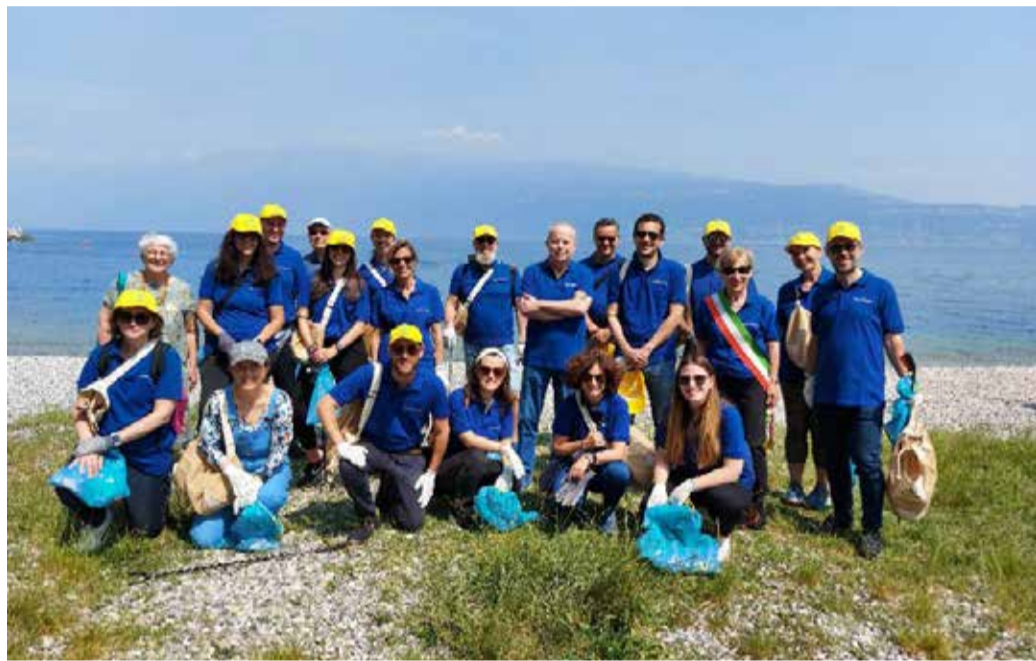
I volontari alla spiaggia di Toscolano Maderno

info@megcarservice.it - www.megcarservice.it