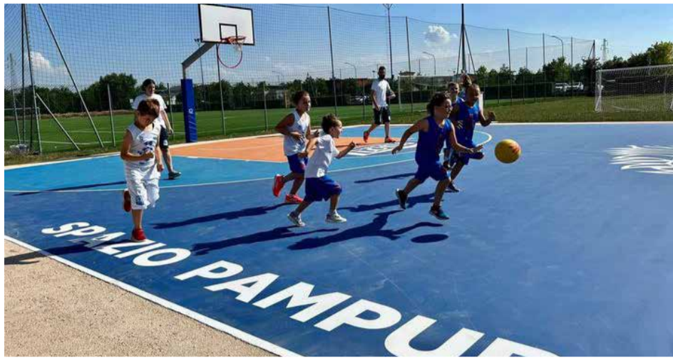
BRESCIA: La nuova piastra per il basket allo Spazio Pampuri di Sanpolino