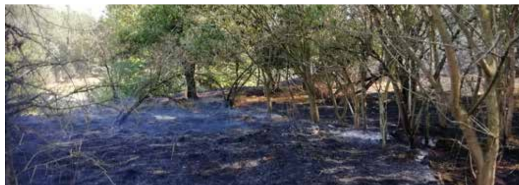
L'area bruciata a Barco