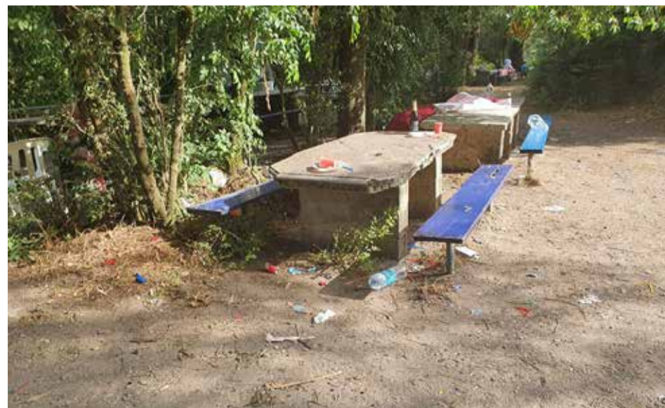
Quello che resta di una festa di incivili al fiume Oglio, all'Oasi dei Pensionati