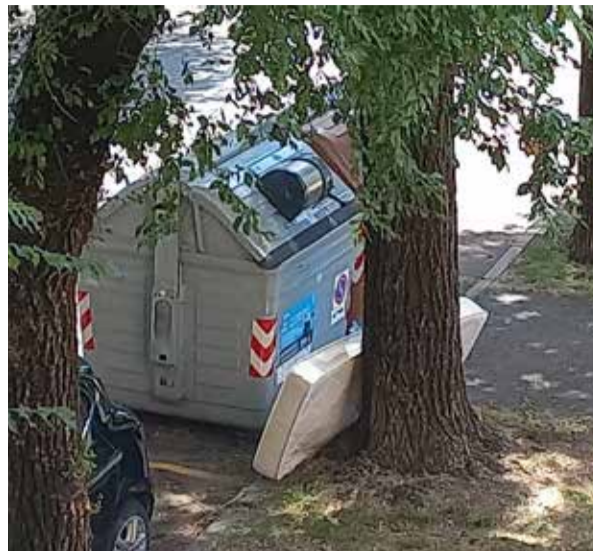
BRESCIA: un materasso abbandonato in via Lamarmora