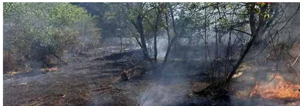
Il rogo a Torre Pallavicina

Il numero di roghi, il fatto che si tratti di fenomeni ravvicinati nel tempo e le alte temperature fanno temere che altri incendi possano interessare il territorio del Parco, ormai pesantemente segnato dalla siccità. Per questo i volontari e la vigilanza del Parco stanno aumentando i controlli per cercare di prevenire nuovi incendi. ■