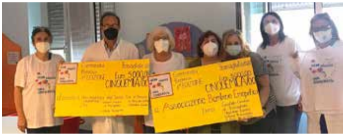
La consegna della donazione in reparto

La consegna del denaro raccolto durante l'iniziativa è avvenuta il 23 giugno scorso.