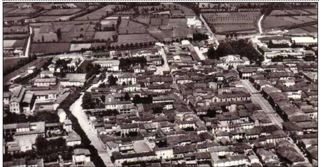
Veduta aerea di Orzinuovi... correva l'anno 1962

L'EDICOLA DI VICTORIA Da noi puoi ritirare i mensili Under Brescia Il Giornale di Chiari