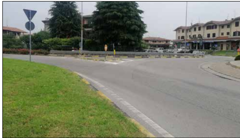
TORBOLE CASAGLIA: la segnaletica orizzontale merita una ripassata