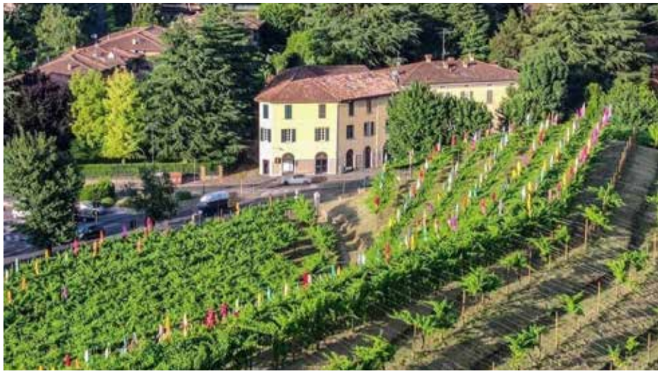
BRESCIA: gli ombrelloni installati nel vigneto Pusterla. Un'opera d'arte dell'artista camerunense Pascale Marthine Tayou