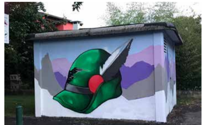
Il murales sulla cabina Enel in via IV Novembre dedicato agli Alpini