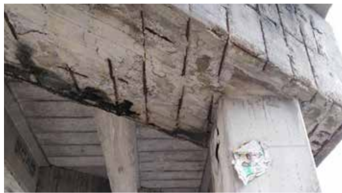
Le condizioni del cavalcavia Moro destavano preoccupazioni tali da aver indotto l'Amministrazione comunale a chiuderlo