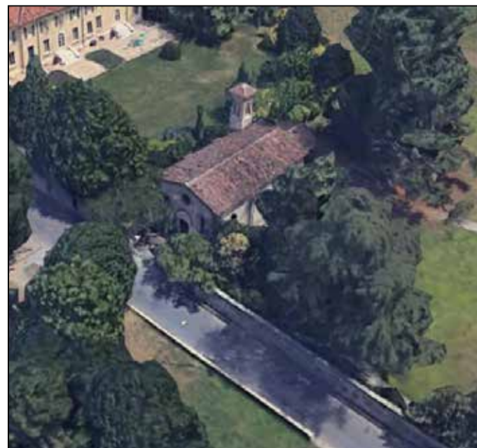
Vista dall'alto della chiesa