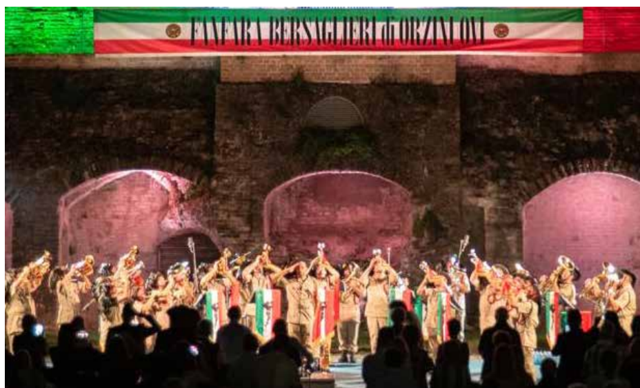
La fanfara dei Bersaglieri di Orzinuovi "C. Valotti": un punto di orgoglio nel panorama culturale della città di Orzinuovi