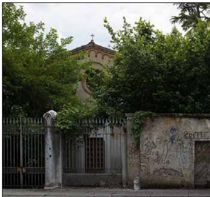
La chiesa di San Calimero

Ciò che risulta tuttavia è che Calimero fu molto amato dai cittadini di Milano, tanto che, subito dopo la sua morte, fu costruita una basilica per onorarlo che, ristrutturata nel corso dei secoli, è tuttora presente ed ospita nella sua cripta le ossa del santo. ■