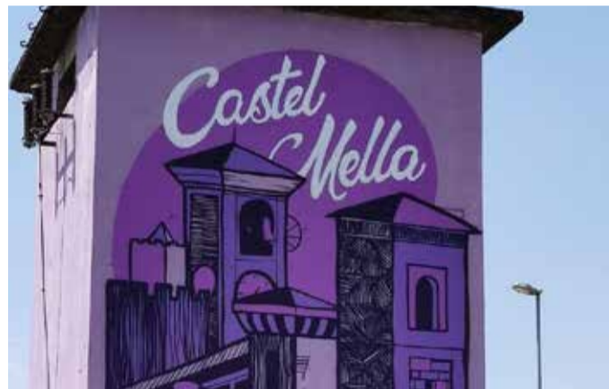
La riqualificazione della cabina pozzo irriguo in Viale dei Caduti