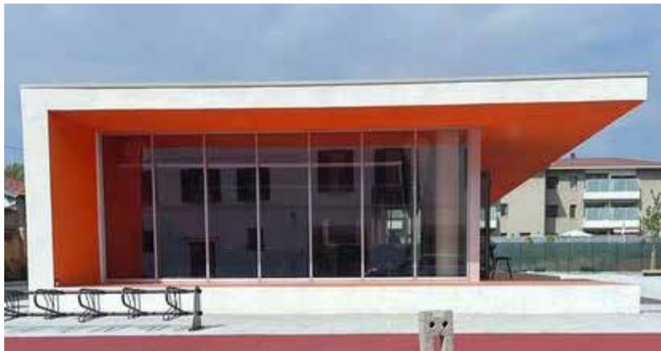
BRESCIA: la nuova Sala Studio per gli studenti in via Milano