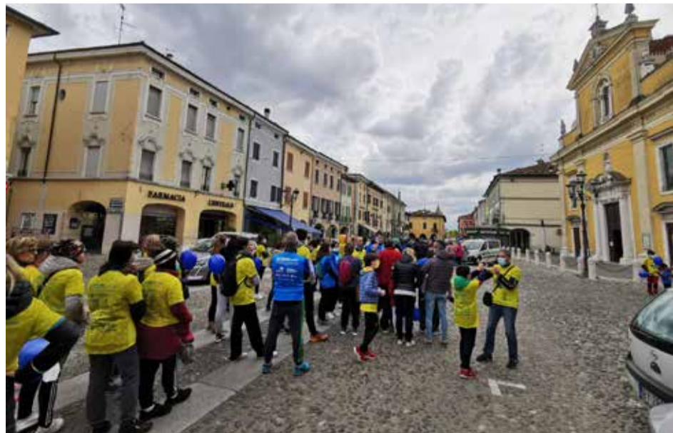
La camminata per l'autismo svoltasi ad Orzinuovi