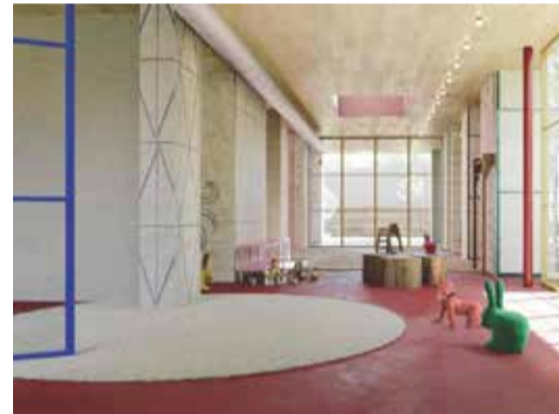
Da sinistra: l'attuale asilo nido di Castelmella e il rendering del nuovo