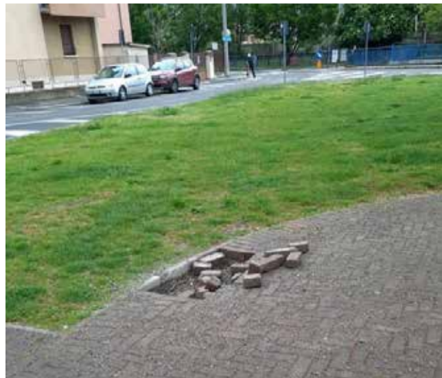
BRESCIA: le condizioni del marciapiede ai giardini di via Repubblica Argentina