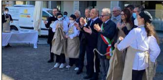
L'inaugurazione del pastificio

diventare un modello di integrazione sociale ed economia sostenibile. Nel labora-