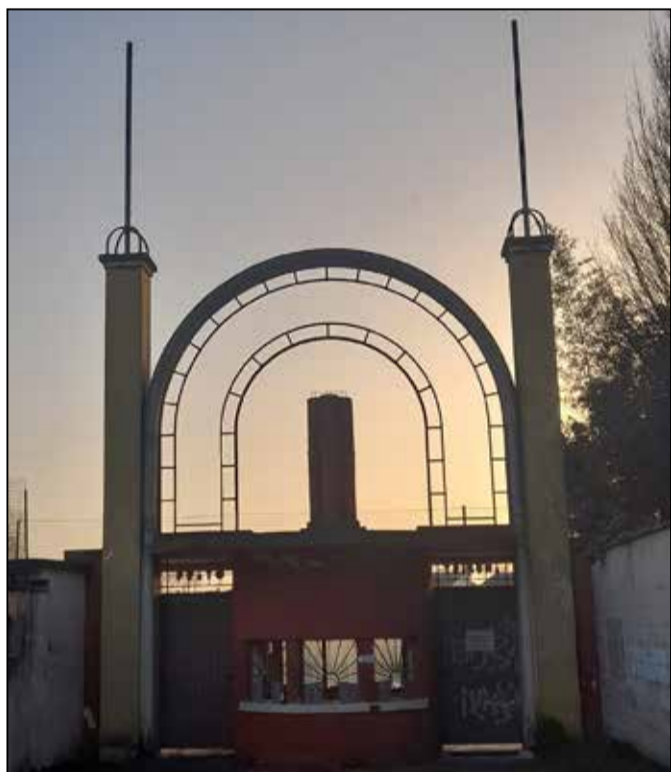
L'ingresso dell'ex stadio comunale di Orzinuovi

dotte da operatori e fruitori dei servizi: fotografie, video, disegni, che provano a delineare una diversa percezione dei lavoratori che si occupano di fragilità, e delle persone che questa fragilità la rendono non negoziabile ed evidente, che siano disabili, pazienti psichiatrici, bambini che vivono situazioni di disagio o adulti che hanno perso tutto quello che avevano. ■