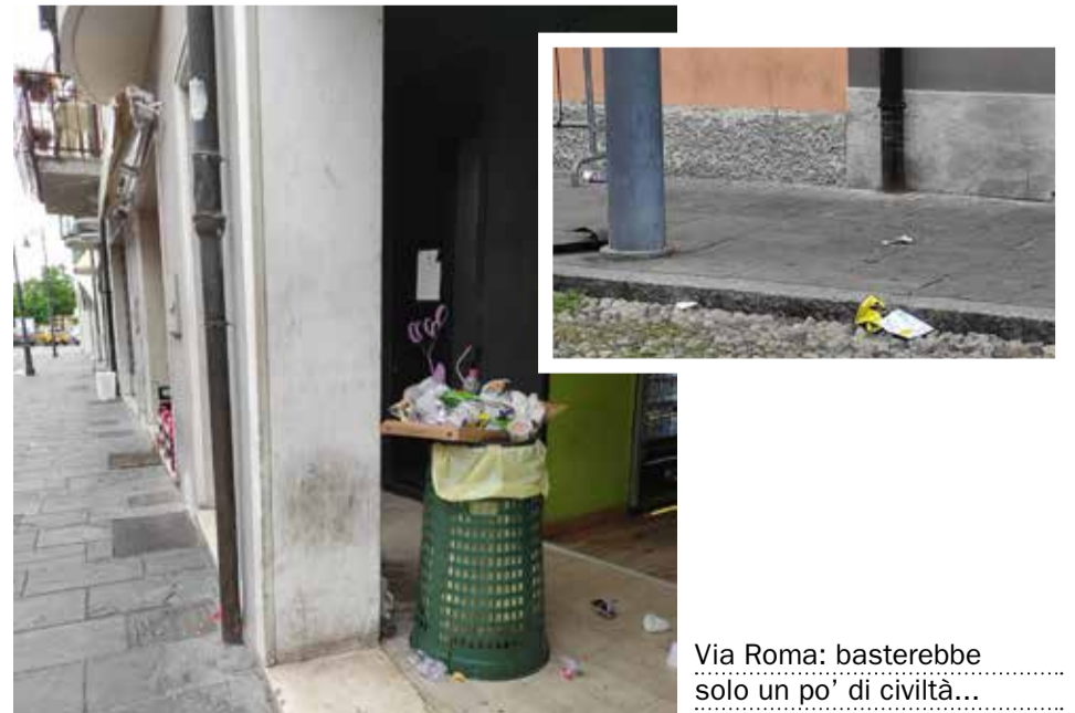
Via Roma: basterebbe solo un po' di civiltà...