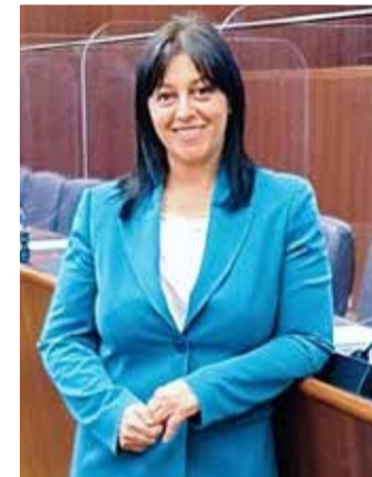
Il consigliere regionale leghista Francesca Ceruti

tenariato per progetti mirati all'inclusione sociale e al contrasto al disagio giovanile. I contributi saranno fino all'80% e le domande potranno essere presentate dal 2 maggio al 6 giugno 2022. ■