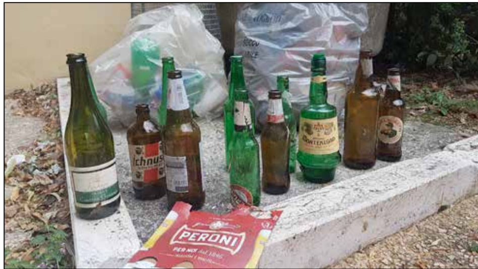
LOGRATO: le bottiglie abbandonate al parco di Villa Morando, poi raccolte da volontari