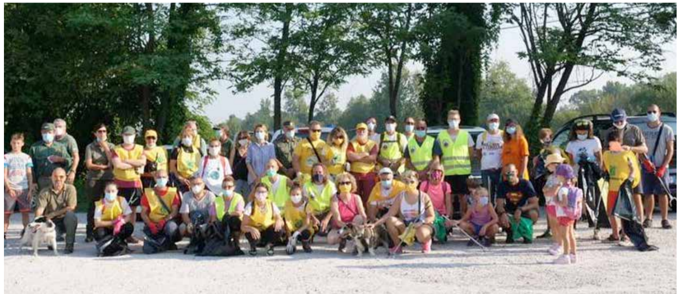
I volontari che hanno partecipato all'iniziativa “Puliamo il mare partendo dal fiume”