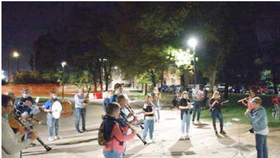
RONCADELLE: l'esibizione della Banda cittadina al parco Cono Ottico