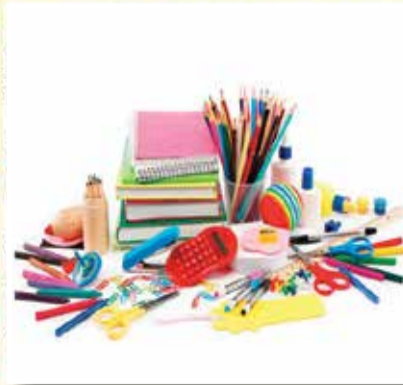
FALL. CAVALLI - CANCELLERIA PER SCUOLA E UFFICIO