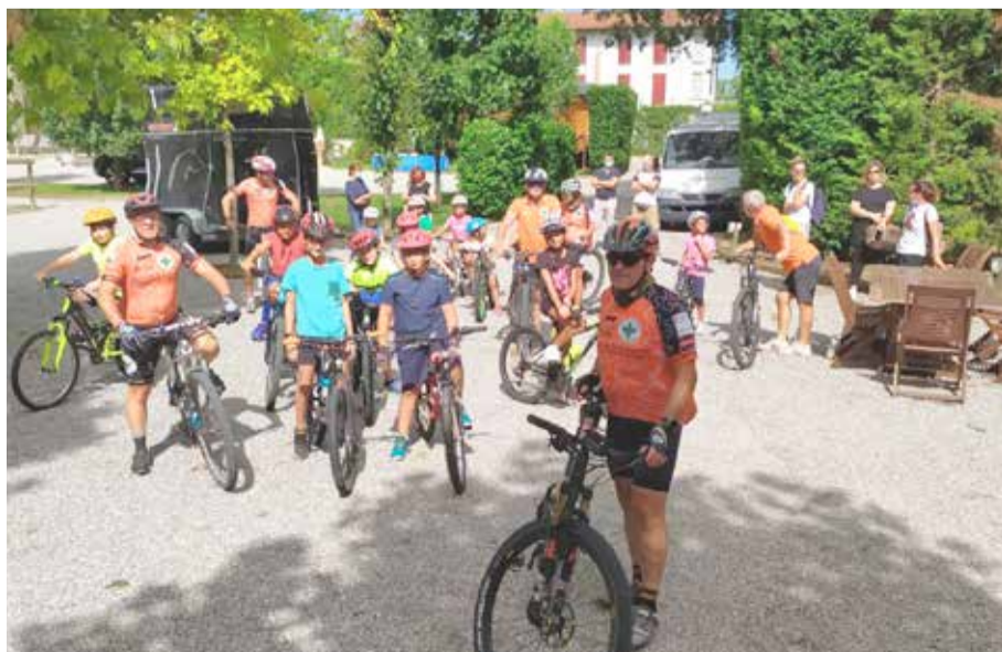
Il gruppo Scuola Divertimento MTB organizzato dal G. S. Croce Verde Orzinuovi