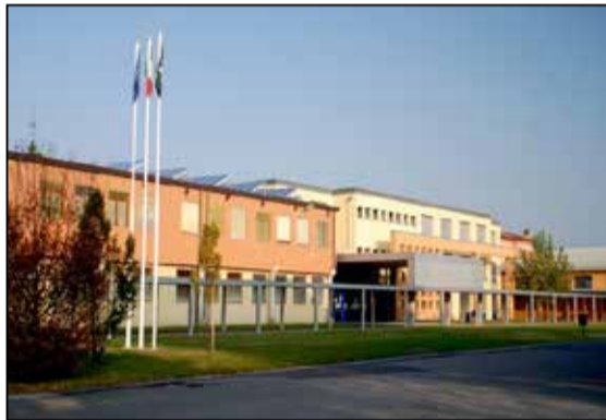
La scuola primaria