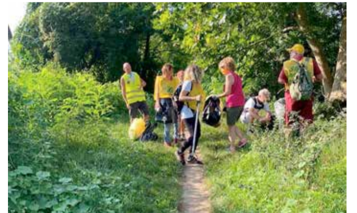
I volontari impegnati nella pulizia delle rive del fiume Oglio