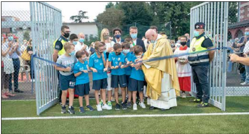
L'inaugurazione del campo dell'oratorio San Michele

in parte con quanto l'Oratorio aveva in cassa, somme risparmiate proprio in vista dei lavori, e con un finanziamento a tasso zero. Per sostenere lo sforzo economico la Parrocchia ha deciso di lanciare anche una raccolta fondi: l'obiettivo è raccogliere 150mila euro. La raccolta fondi è stata denominata "Operazione Mattone" perché in chiesa verrà posto un tabellone in cui verrà aggiunto un mattone per ogni 50 euro donati. ■