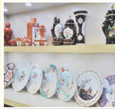
FALL. MORONE - PREGIATE CERAMICHE E CRISTALLERIE