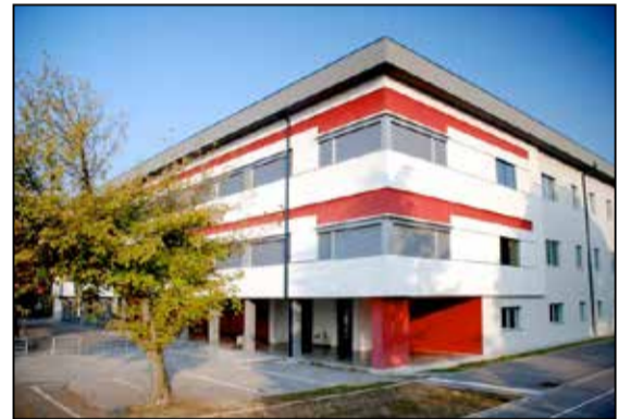
La scuola secondaria