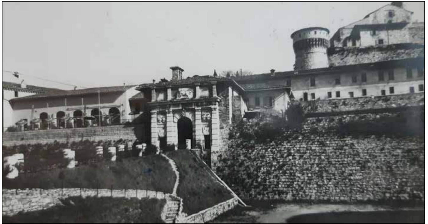
Il Castello di Brescia in un bianco e nero degli anni Sessanta