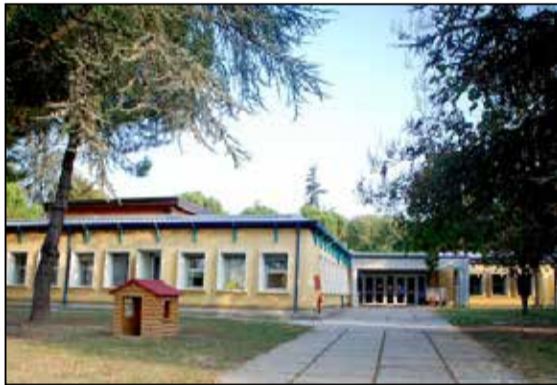
La scuola d'infanzia Sironi

Le famiglie interessate saranno contattate dall'ufficio Servizi Sociali.