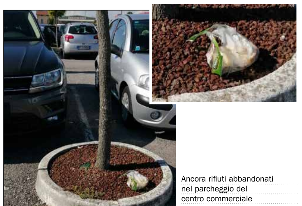
Ancora rifiuti abbandonati nel parcheggio del centro commerciale