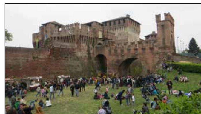
La Rocca durante una vecchia edizione di Soncino Fantasy

pronti più di 100 animatori e figuranti, con un centinaio di commercianti in procinto di arrivare nel borgo per allestire i loro stand e le loro botteghe. In programma inizialmente per il 25 aprile, la manifestazione era stata sospesa dall'organizzazione, che aveva deciso di posticiparla al mese di settembre sperando che l'emergenza sanitaria fosse risolta. Così non è stato e, inevitabilmente, è arrivata la decisione del definitivo rinvio. Il prossimo “Soncino Fantasy” si svolgerà il 25 aprile del 2021. ■