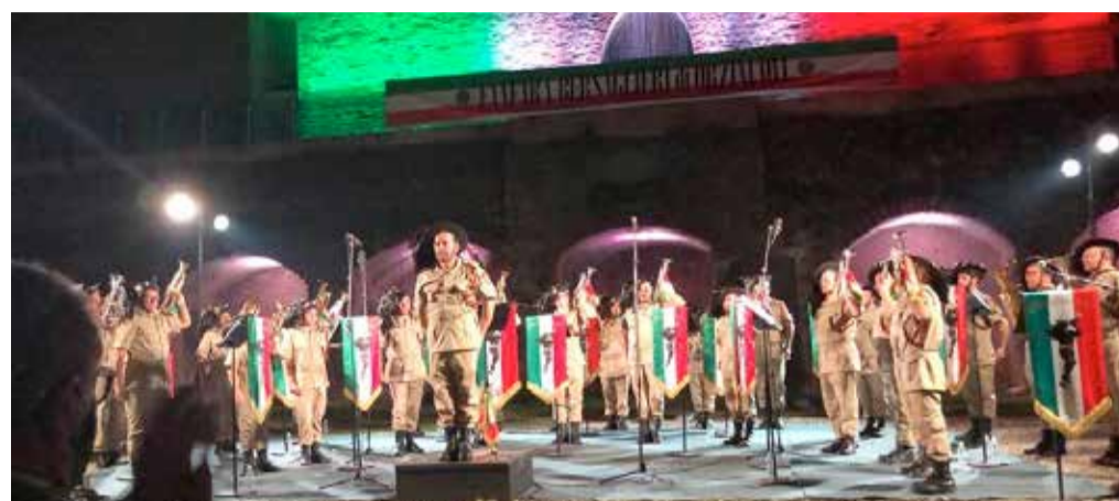
La Fanfara dei Bersaglieri durante il concerto