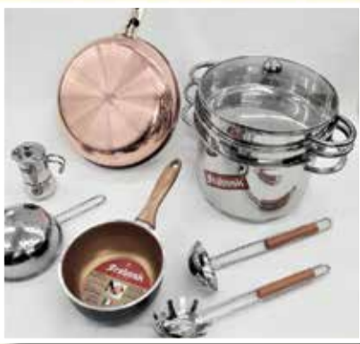
FALL. FRABOSK PENTOLE E PADELLE