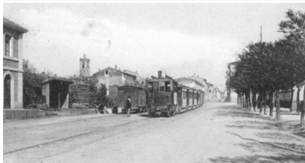
La tramvia Brescia-Soncino